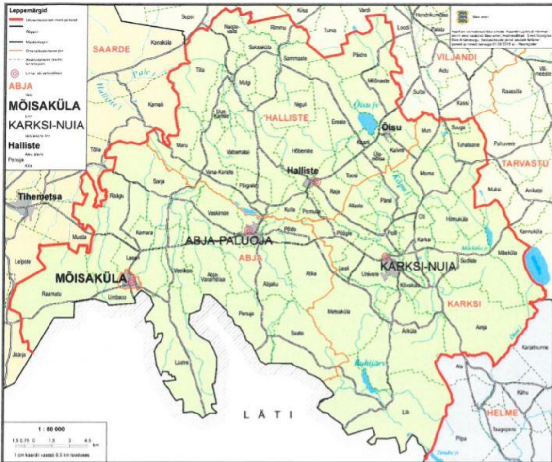
Joonis 3.1. Mulgi valla piirid.

Mulgi vald paikneb Viljandimaa edela- ja lõunaosas. Vald piirneb lõunast Läti Vabariigiga, läänest Saarde vallaga (Pärnumaa), loode poolt Põhja-Sakala vallaga, põhja, kirde ja ida poolt Viljandi vallaga, kagu suunalt Tõrva vallaga (Valgamaa). Valda läbivad põhimaanteedest Valga-Uulu maantee, tugimaanteedest Imavere-Viljandi-Karksi-Nuia maantee, Karksi-Nuia – Lilli ja Mõisaküla tee.