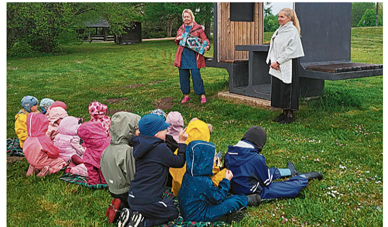
Olstre lasteaia, kooli ja raamatukogu ütine jundam peeti Olstre järve veeren.