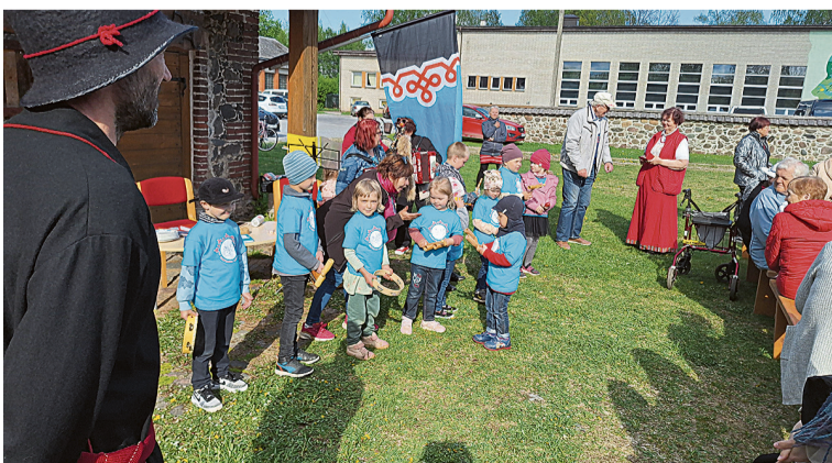
Tarvastu käsitüükoa õvve pääl peeti pikälavvapidu ütine tantsu, laulu ja mängege.