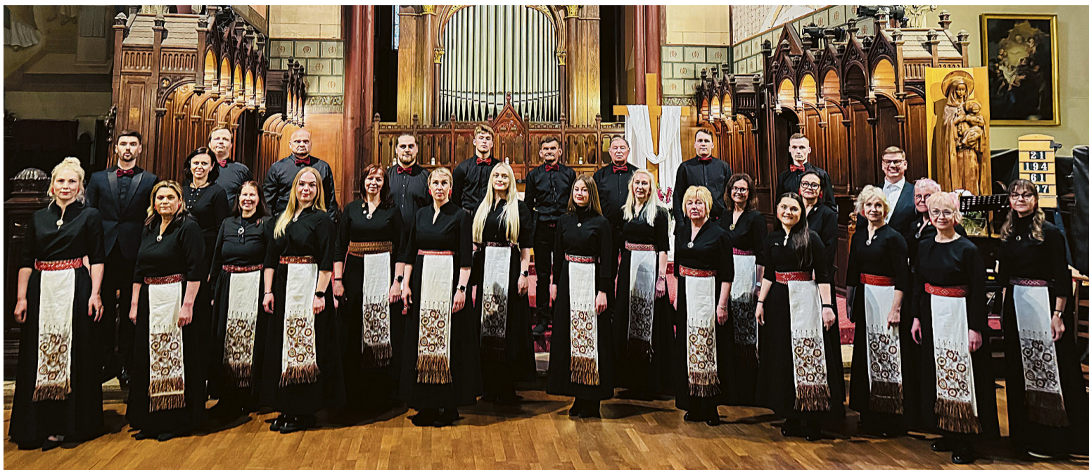
Mulgi segäkuur Pariisin Saint-Martin-des-Champsi kirikun.