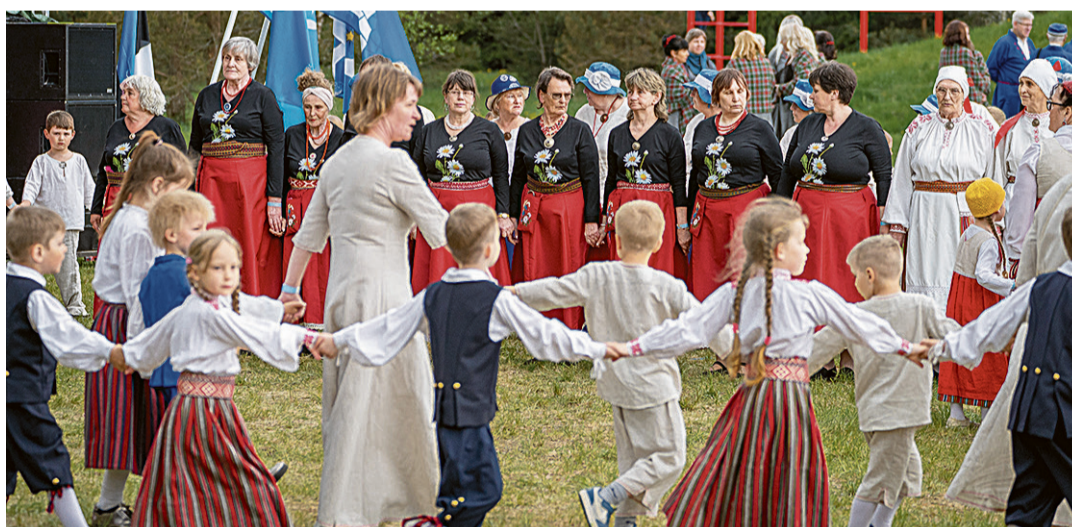
Mulgi pidu tuup kokku latse ja suure, köüdäp kokku uvve ja vana.