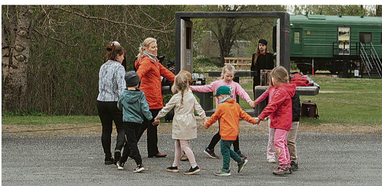
Mõisakülä lasteaia latse Mõisakülä jundamel. Kaabu sihen seisäp pillimis Pärniku Brait.