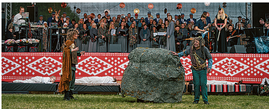
Ilrmumuusikali päätegelase ollive kuradi poja Lisna ja Lasna. Püüne pääl om koorilaulje ja pillimihe.

et ütenukuun laulda, tantsi, kõnelde, tunda röömu ja uhkust oma kultuuriruumi üle.