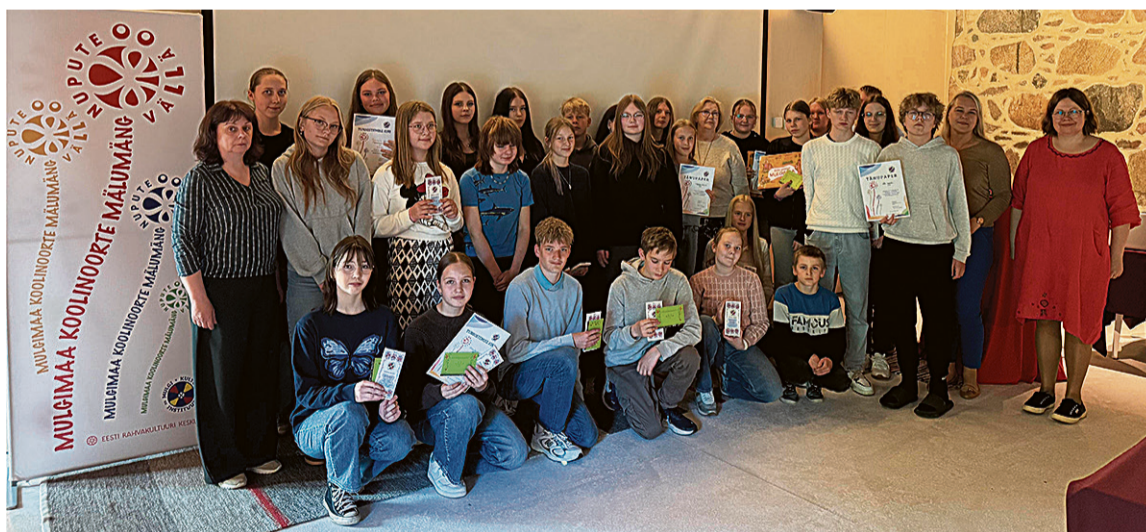
Mulgimaa koolinoorde mälumänguaaste lõppi 27. mail Mulgi elämuskeskuse.

Küsimusi mälumängu jaos teive Mulgimaa raamatukogude tüüteje. Kigil kuvvel mälumän-