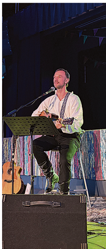
Mulgi vanemb Oksa Priit röömust kullejit jundamege Karksi-Nuia kultuurikeskusen.