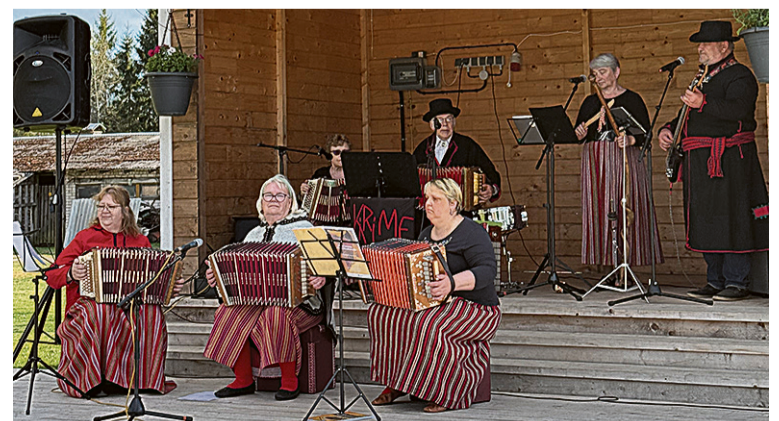
Karjatnurme jundamel ast üles rahvamuusikaansambel Kirime.