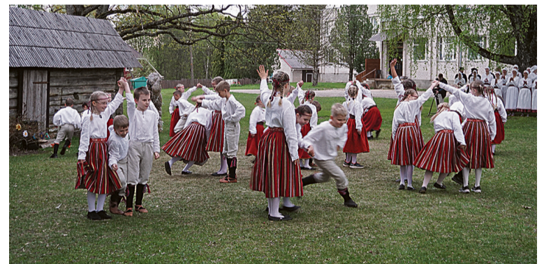
Karksi mulke perepidu olli ütekörrage nii jundam ku Kitzbergi gümnaasiumi kevädekonserert.