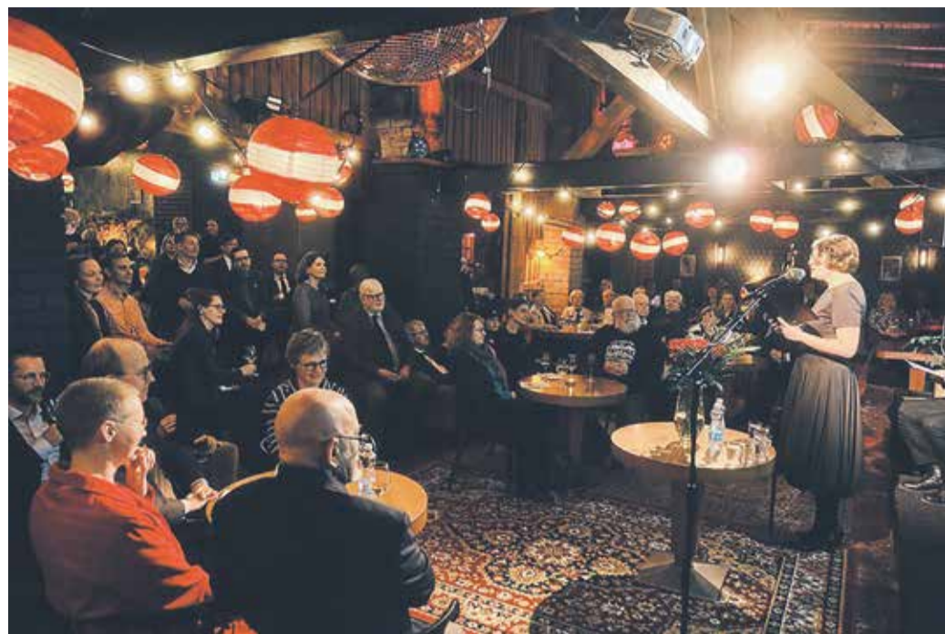
Õpigrupp Läti Vabariigi aastapäeva tähistamisel Tallinnas.

Samuti on ühised ja lutuskäigud Valmiera