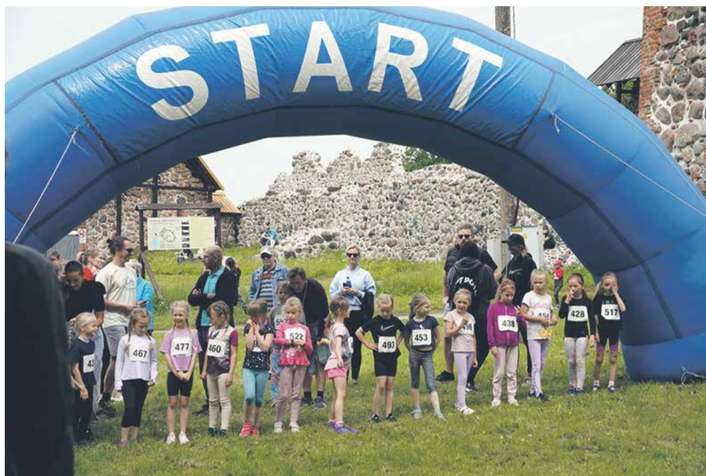
Kõige pisemad jooksusõbrad on stardiks valmis.

Kutsume kõiki suuri ja väikseid spordisõpru osa saama Karksi-Nuia tradit-