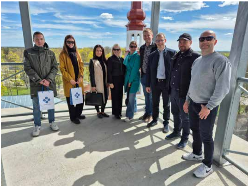
Valla esindus Põltsamaal õppereisil.

6. mail külastati Põltsamaa linna, kus tutvuti kohaliku linnaruumi ja piirkonna arengutega. Avali-