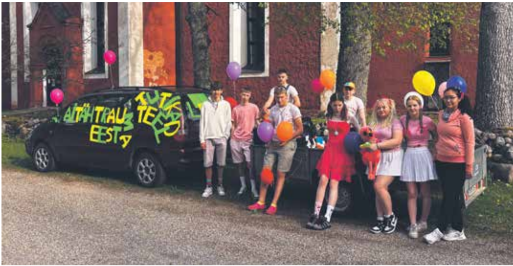
Legendid on kogunenud.