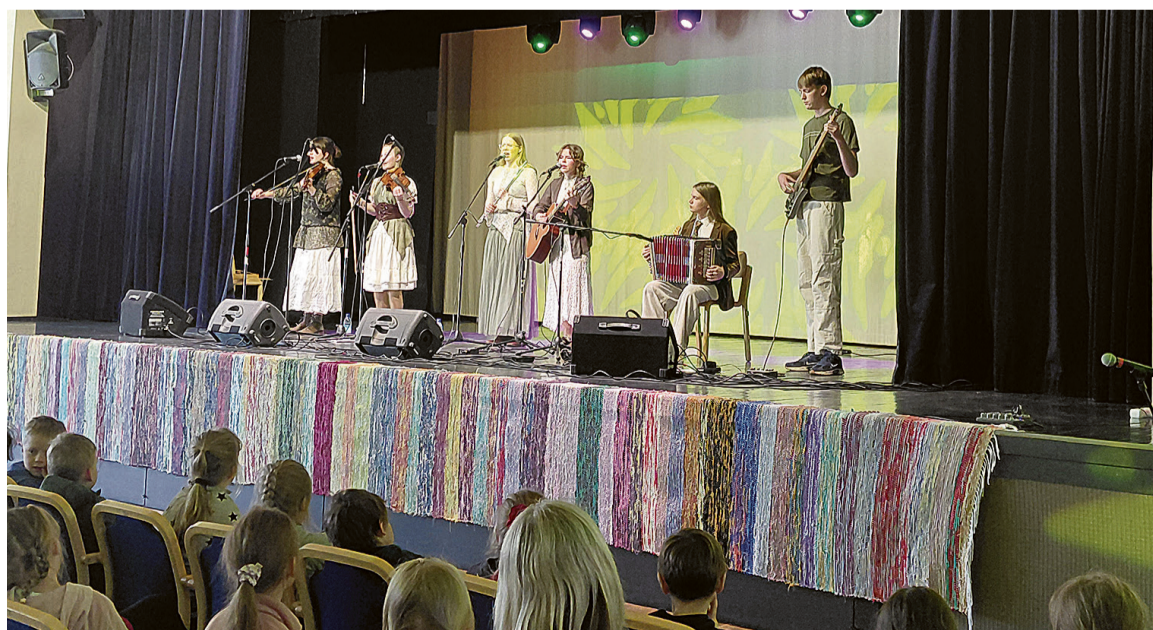
Ansambel Tuik sai Karksi-Nuiast nuuri pooleidjit manu.

Karksi-Nuia Kultuurikeskuse juhateje Mulgi kiil: Ilves Kristi