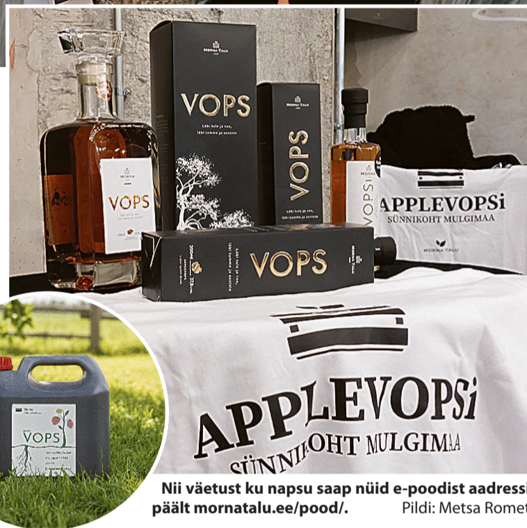
Nii väetust ku napsu saap nüid e-poodist aadressi päält mornatalu.ee/pood/ .

“Meie jaos om väige tähtis, et Applevops ku uus juuk ja maatahis om sündünü just siin, Mulgimaal Morna külän. Sii om mede kingitus Eesti joogikultuurile ja tuup au sissi mede oma tuuraine. Inimestele pakup suurtt uvi ka täädmine, et mede juuk om tiheste köüdet Mulgimaa kuulsa Oti mõtsikuge, mes kasvap mede talu lähiksen. Sii ligi 300-aastene auväärt mõtsubinepuu om iki elujõun ja me paneme selle mõtsikit ubinit raasike maigus oma napsu sissi kah. Sedäviisi saap jusku jupike Mulgimaa aalugu kah pudelise.”