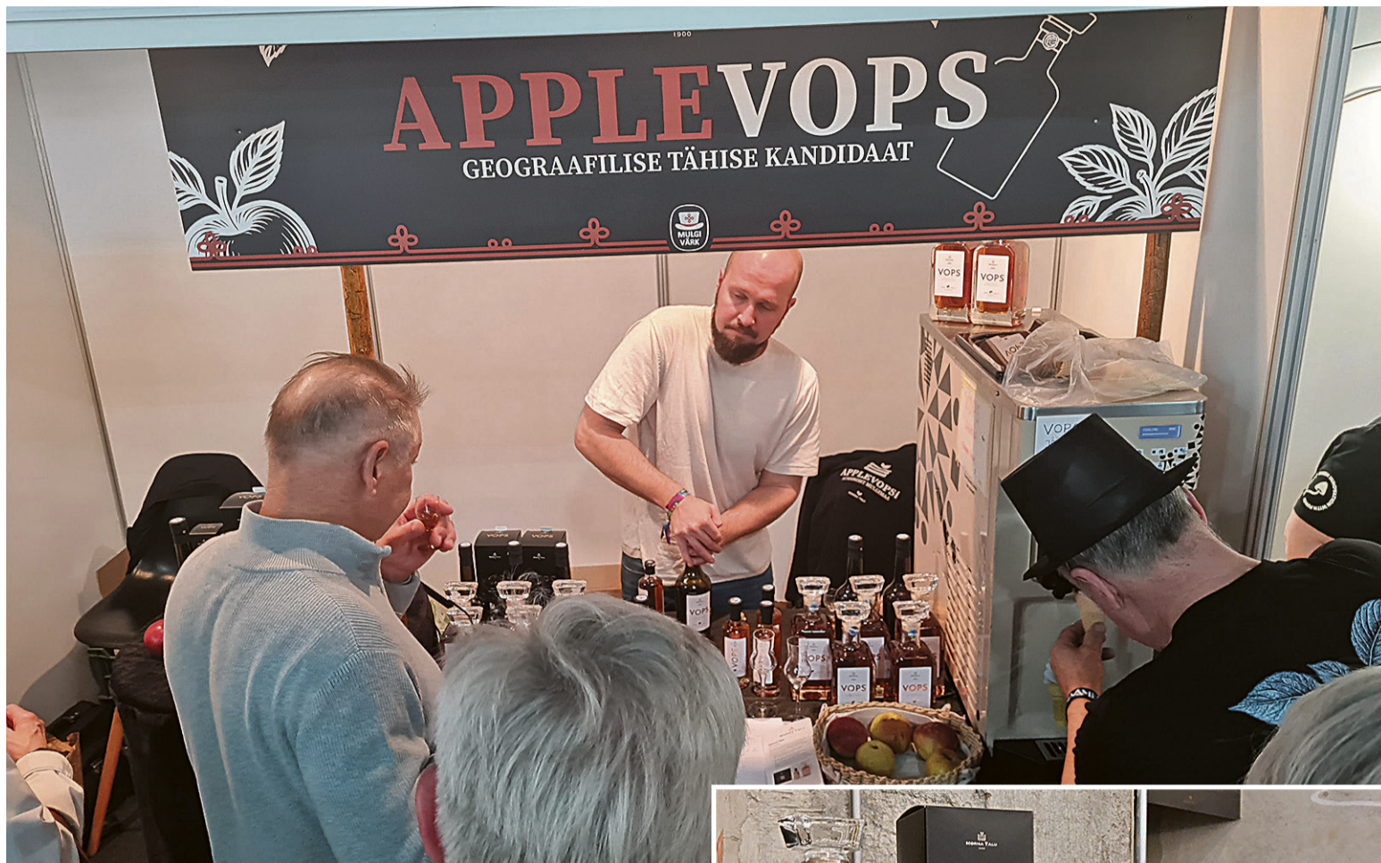
Maamessi pääl pakk rahvale Morna talu ubinenapsu poig Metsa Romet ja jäätust temä esä Metsa Andres.

MaheVOPS om Morna talu väetus, mes annap taimele ram-