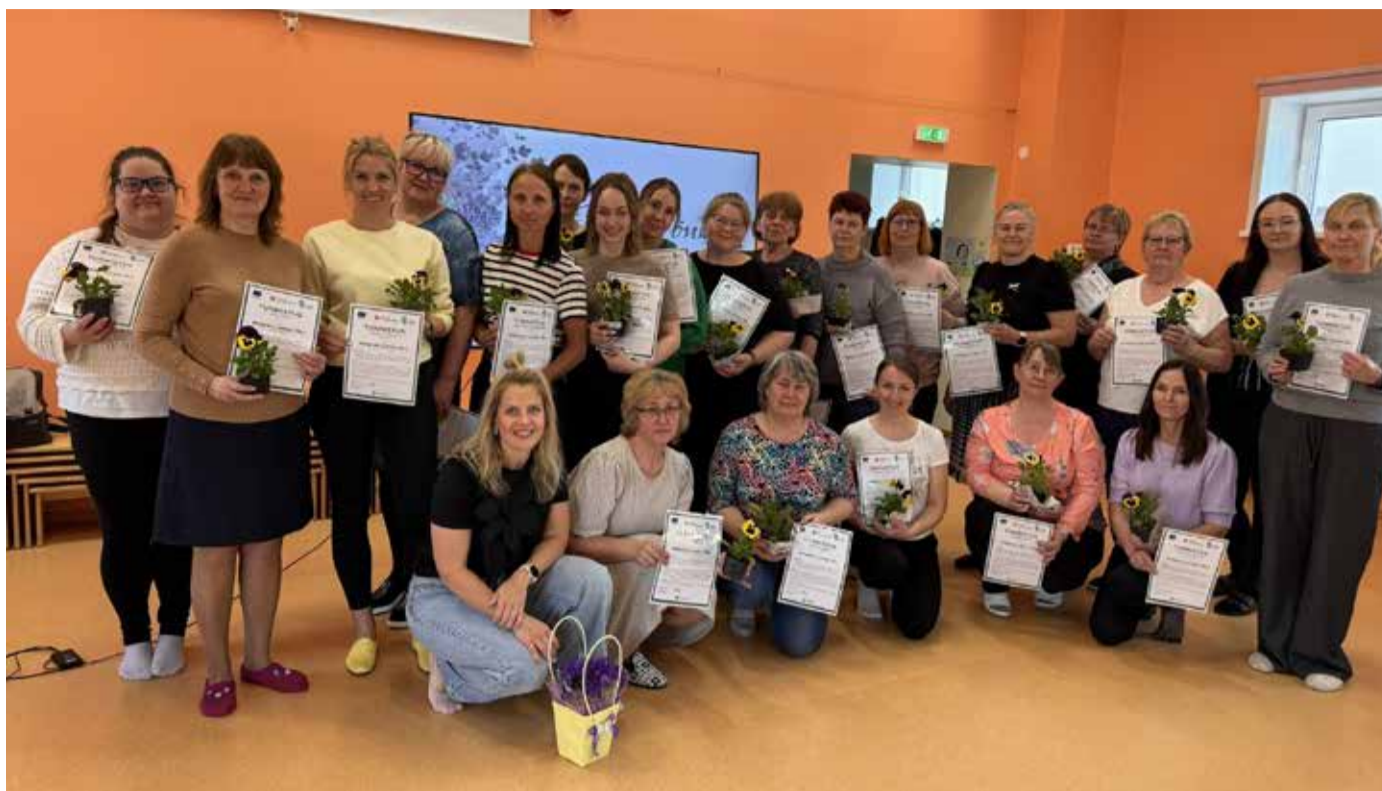
Kolmanda grupi lõpuseminar.

Lähenemise keskmeks on rahulik ja hinnanguvaba vestlus õpetaja või tugispetsialisti ning lapsevanema vahel. Vestlusel räägitakse lapse igapäevaelust ja arengust, peresuhetest ja kodusest keskkonnast, õppimisest, lapse meeleolust ja emotsionaalsest heaolust ning sotsiaalsetest suhetest. Oluline on, et tähelepanu ei ole ainult muredele, vaid ka sellele, mis lapsel ja perel juba hästi toimib. See loob usaldust ja aitab