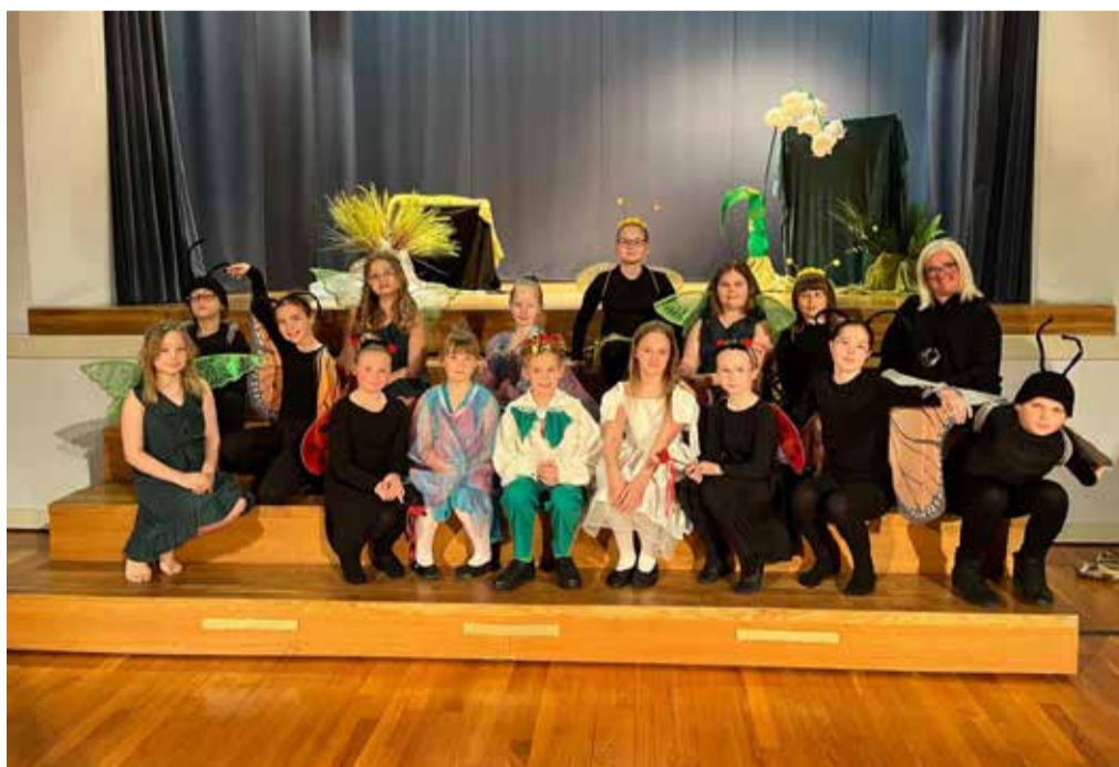
Noored näitlemishuvilised on täis nakatavat tegutsemislusti.