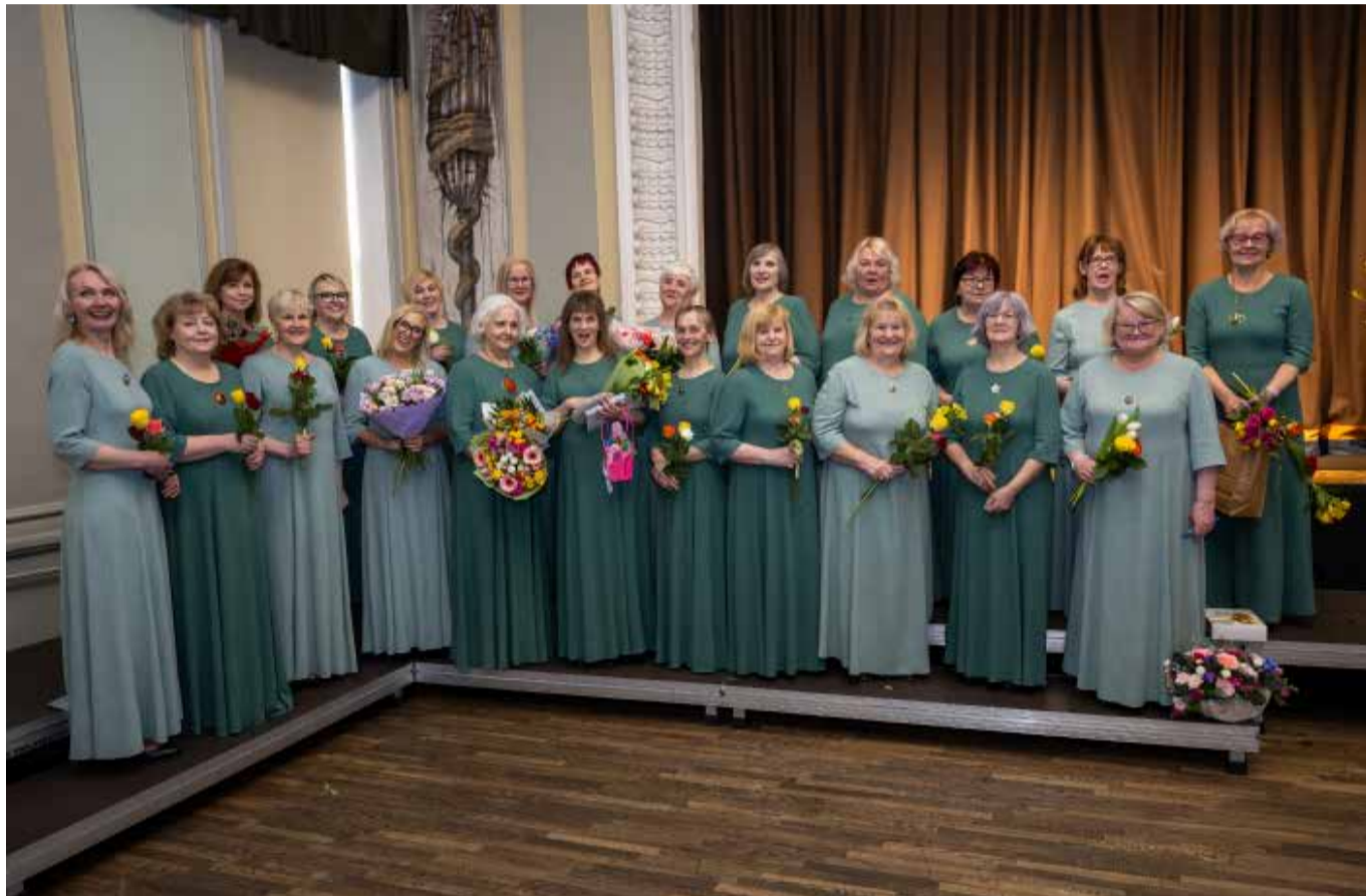
Õbeäidsme 15. sünnipäev.