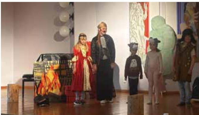
1. klassi õpilased esinevad inglise keelse näidendiga.