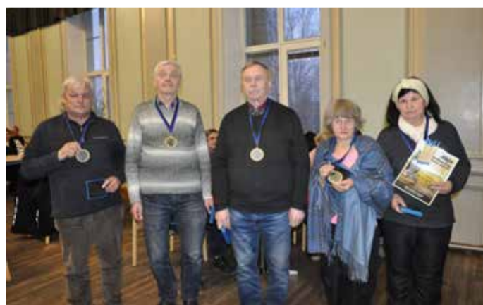
I koht – võistkond Tuhalaane.