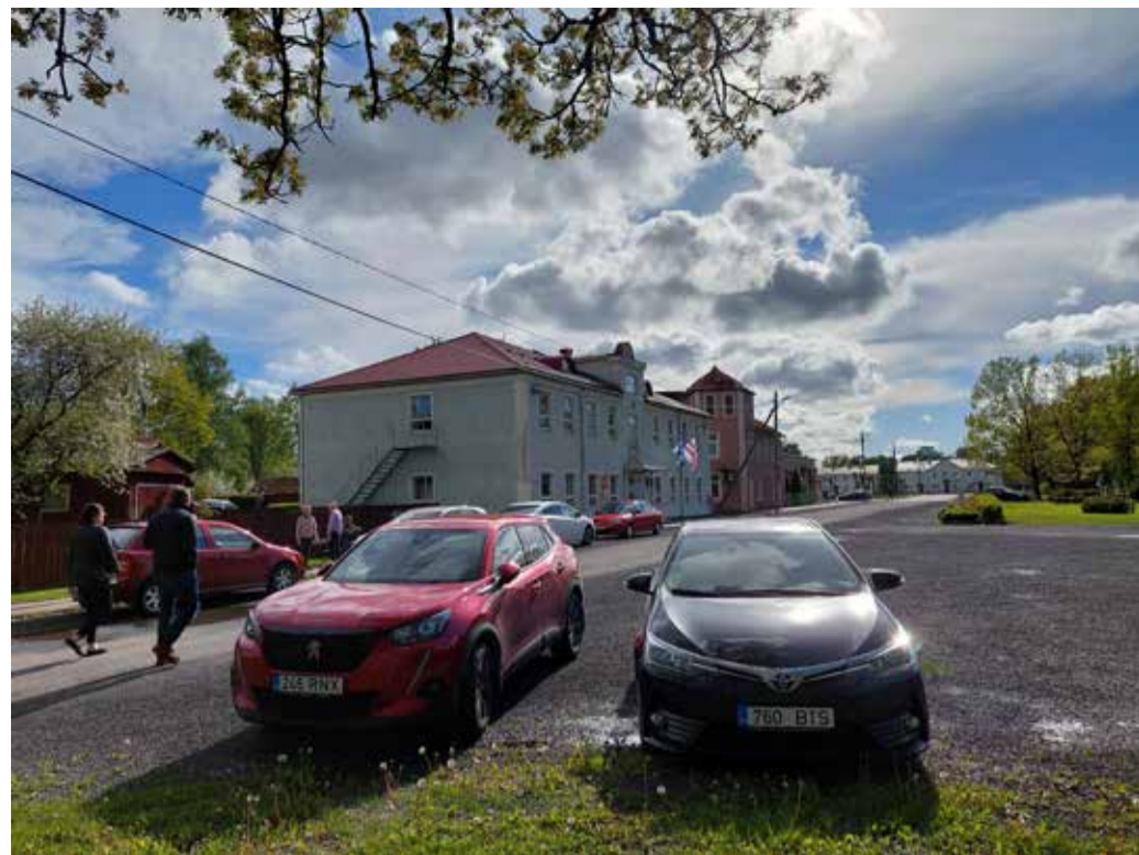
Muuseumiöö toimub iga ilmaga. Pilt on tehtud 2022. aastal.

Seetõttu jäi teise vooru kolm teemat: „Öös on usaldust”, „Öös on hääli”