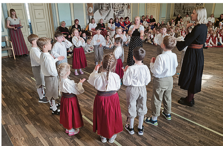
Abja lasteaia laste ja õpeteje „Midrilindu“ mängmän.