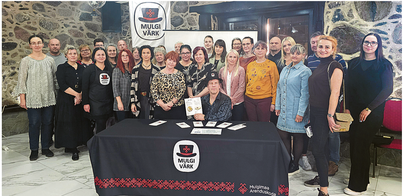
Mulgi märgi omanigu saive Talu villan kokku, et möttit vahete ja müüginõkse õppi.