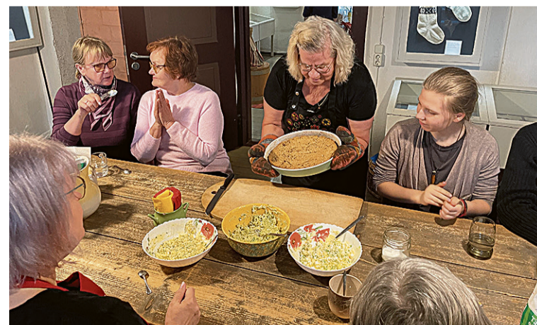
Laande Alli tõi lavva pääle ahjust võetu kuuma kesväkaraski, mida olli munavõige ää süvvä.

“Tähtis ei ole pallalt retsept, kuigi retsepti om olemen ja kik saave nii kodu üten – me mõtleme perimussüükest ku elävest asjast. Söögil om ollu ja om prilagi suur mõjo inimeste egäpäevätsesele elule, tüütegemisele ja endetäädämisele.”