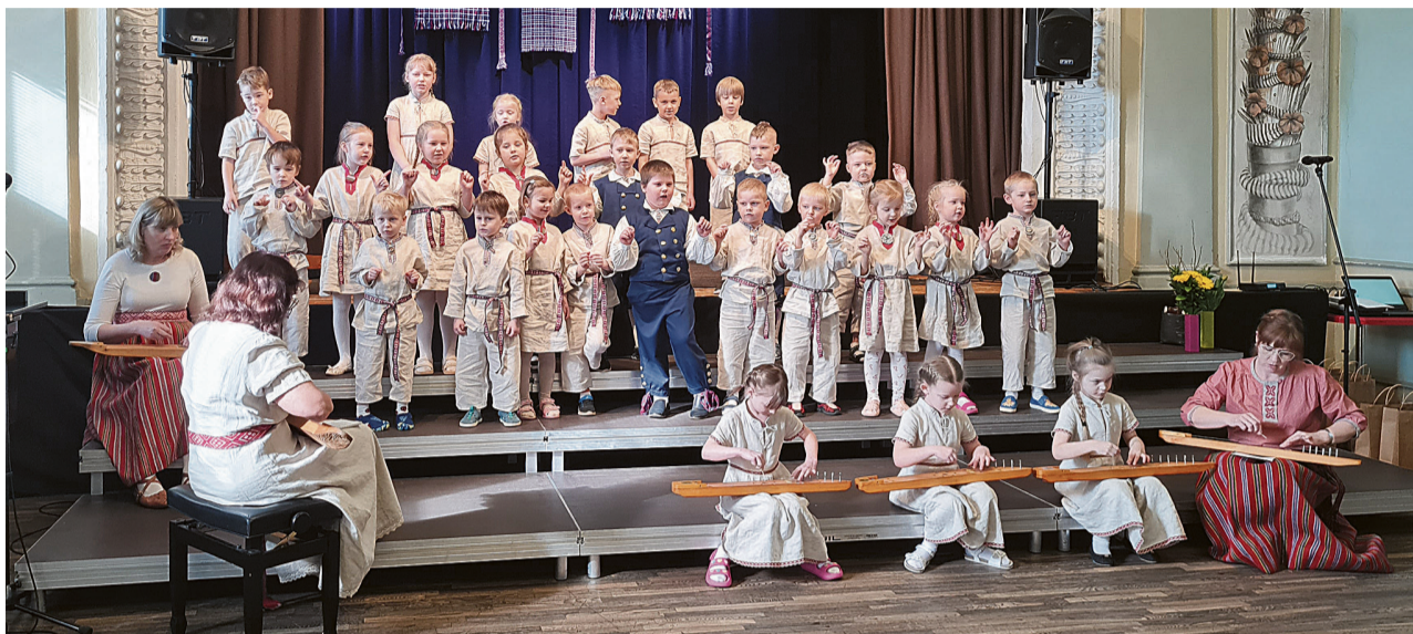
Ritsu ja Tõrvalille lasteaia laste astsive üles lauluge „Keväde tulek“, mille olli neile selges õpenu õpeteje Viskov Katrin.