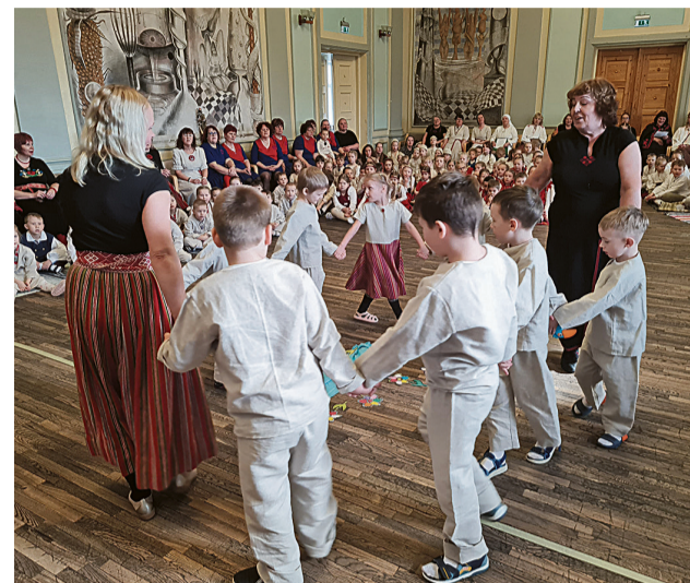
Ala laste ja õpeteje mängsive laulumängu „Keväde“.