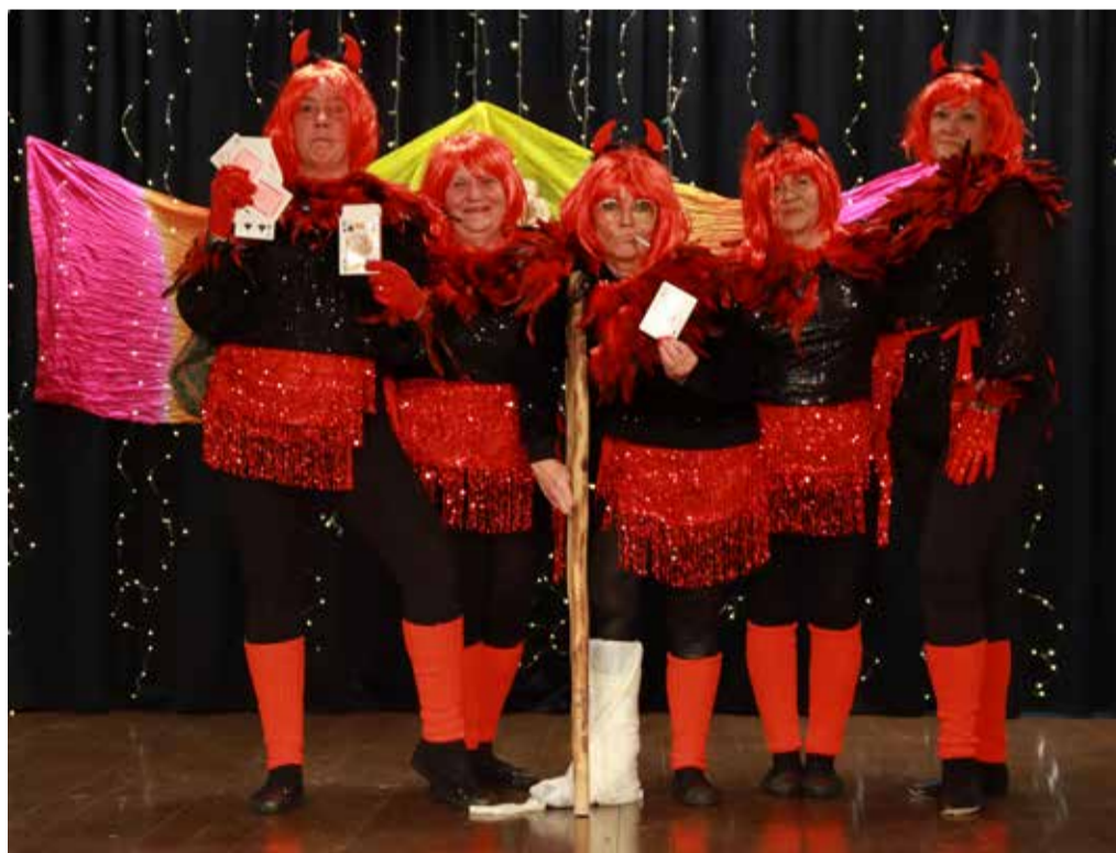
25. aprillil oma 30. aasta juubelit tähistav tantsurühm AERODÜNAAMILISED tantsuga „Kaardipõrgu“.