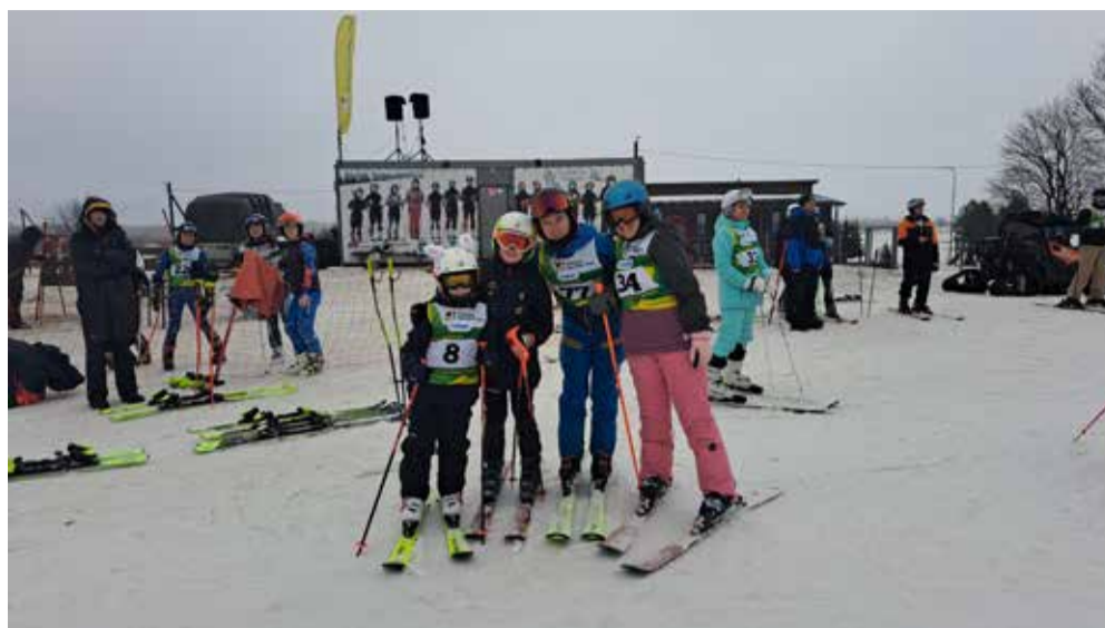
Omavalitsuste talimängudest osavõtjad.