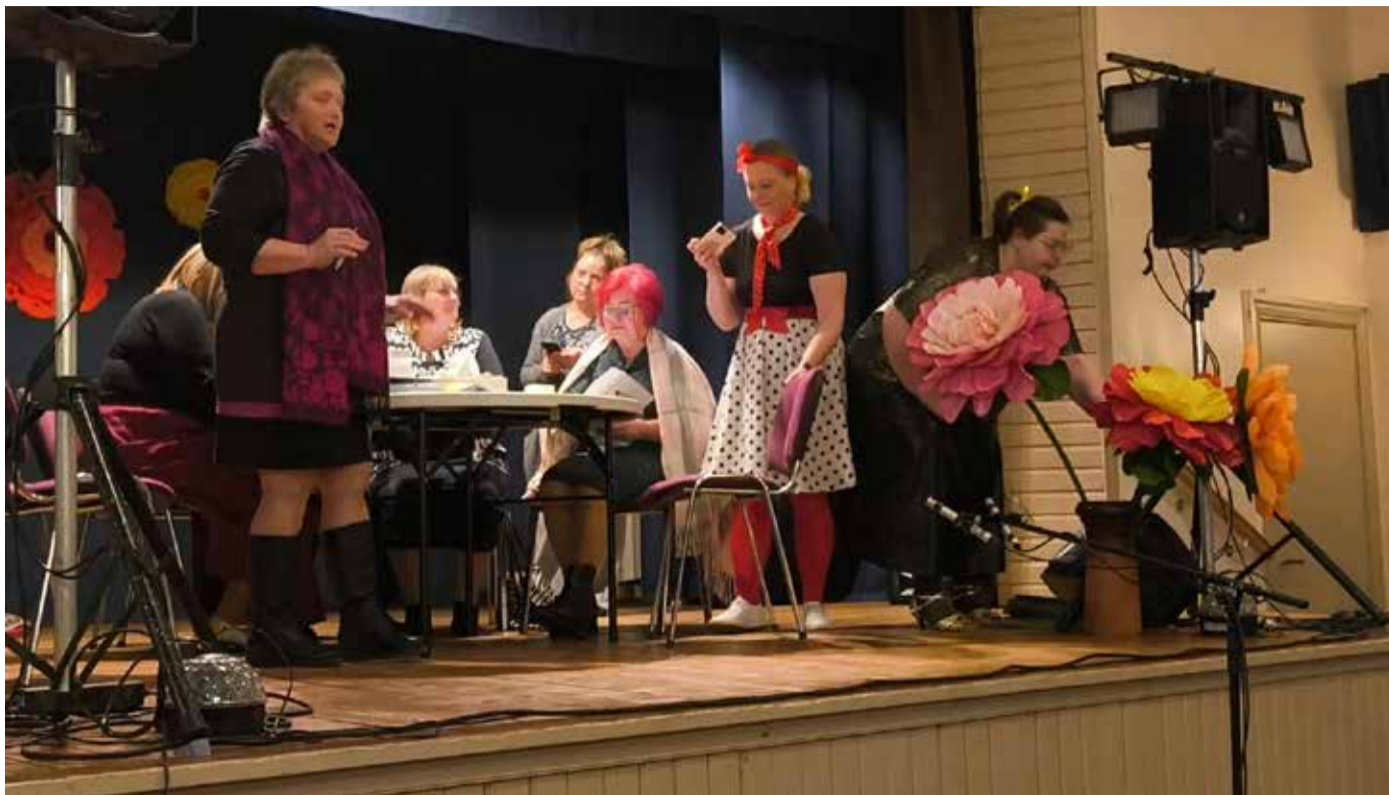
Hetk stseenist, kus allkirjutanu üritas üleelusuuruseid paberist pojenge koosoleku juhataja Tiiule n-õ maha müüa.

Sellised üritused on toetuseks, et väikekohtade elujõud peitub inimestes, kes viitsivad pärast tööpäeva kokku tulla, tekste õppida ja rahvamaja peoks ette valmistada.