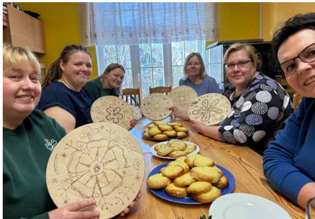
Naiskodukaitsjad põletasid mustreid ja küpsetasid korpe.

Kokkamise kõrval hakkas veerema mälestuste jutukera – igapäev meenus seik või mitu oma lapsepõlvest ning kodustest kommetest. Väga tore ja armas oli