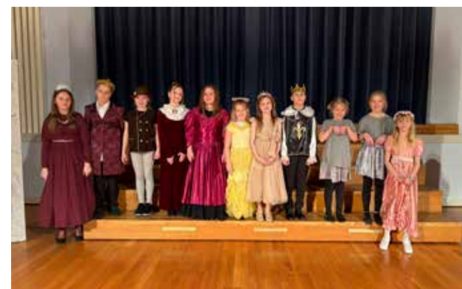
Abja kultuurimaja lasteteater Cipolino Viljandimaa koolinoorte teatripäeval.