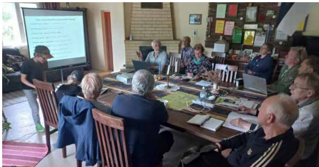
Mulgi vallavalitsus tänab kõiki mittetulundusühinguid, külaseltsi, sportlasi ja teisi ühendusi nende järjepideva ning väärtusliku panuse eest kogukonna ja oma valdkonna arengusse!

eurot projekti „Vana-Kariste Seltsimaja elektrikli renoveerimine“ kaasfinantseerimiseks;