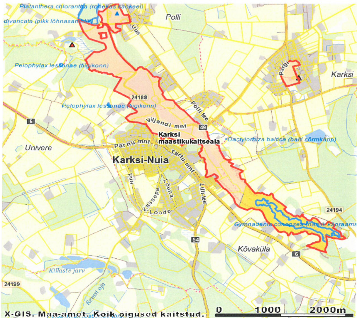
Joonis 4. Karksi maastikukaitseala piiranguvöönd beežika värviga osa, kollasega on märgitud Kõvaküla sihtkaitseala

Planeeringuala jääb Karksi maastikukaitseala piiranguvööndisse (joonis 4), kus kaitseesmärgiks on looduse mitmekesisuse ja maastikuilme säilitamine.