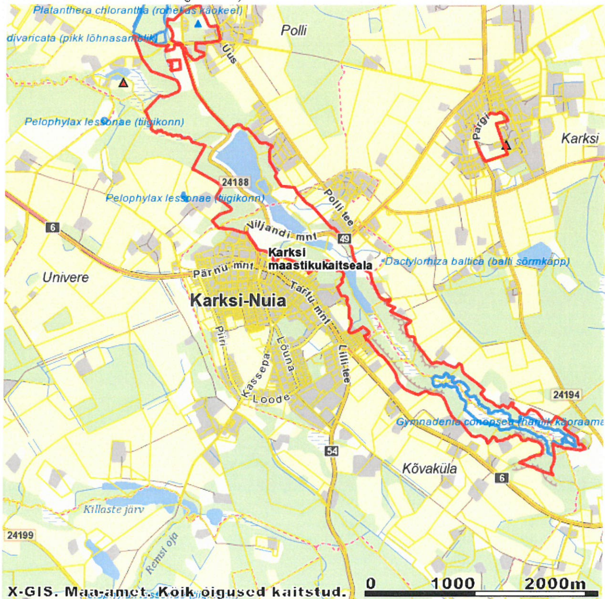
Joonis 2. Karksi maastikukaitseala piir

Planeeringuala asub Mulgi vallas Karksi-Nuia linnas ja osaliselt Polli külas ning see jääb Karksi maastikukaitsealale (joonis 2).