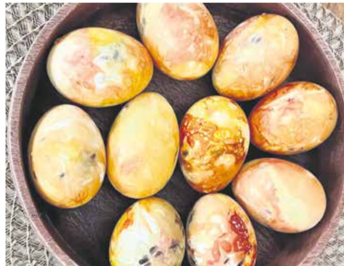
Sibulakoortega värvitud lihavõttemunad.

Ülestõusmispühade ehk munadepühadega seostub komme värvida mune, neid üksteisele kinkida ja koksida – võidab see, kelle muna jääb terveks. Munade värvimise tava päritolu kohta