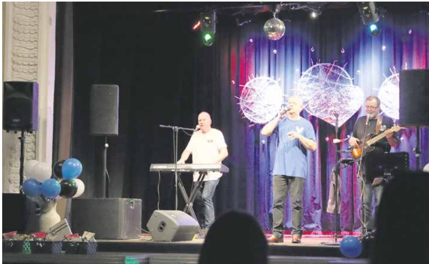
Ansambli Väike Mees meeleolukas esinemine tõi noored tantsupõrandale.

Ürituse õnnestumine ei oleks olnud võimalik