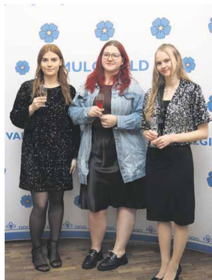
Õhtu algas pidulikult pokaalide kokku löömisega.