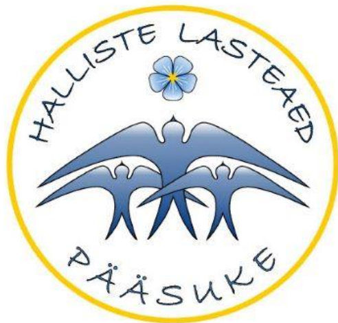
Halliste Lasteaed Pääsuke logo

Toidu valmistab lasteaiale Halliste Põhikooli söökla. Kohale toimetavad lasteaia töötajad. Halliste lasteaias on üks liitühm, plaanitud laste arv on 18 last, sobivate tingimuste olemasolul võib hoolekogu ettepanekul vallavalitsus suurendada laste arvu 2 võrra. Lasteaeda võetakse eelkõige Mulgi valla lapsi, vabade kohtade olemasolul lapsi ka teistest piirkondadest. Lasteaed on avatud 10,5 kuud aastas (v. a kollektiivpuhkuste aeg). Lahtioleku aeg on kell 7.00-18.00.