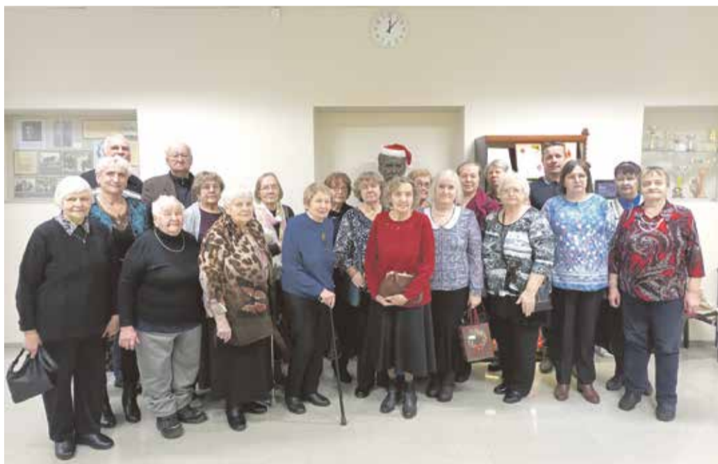
Haridusseltsi liikmed August Kitzbergi nimelises gümnaasiumis.