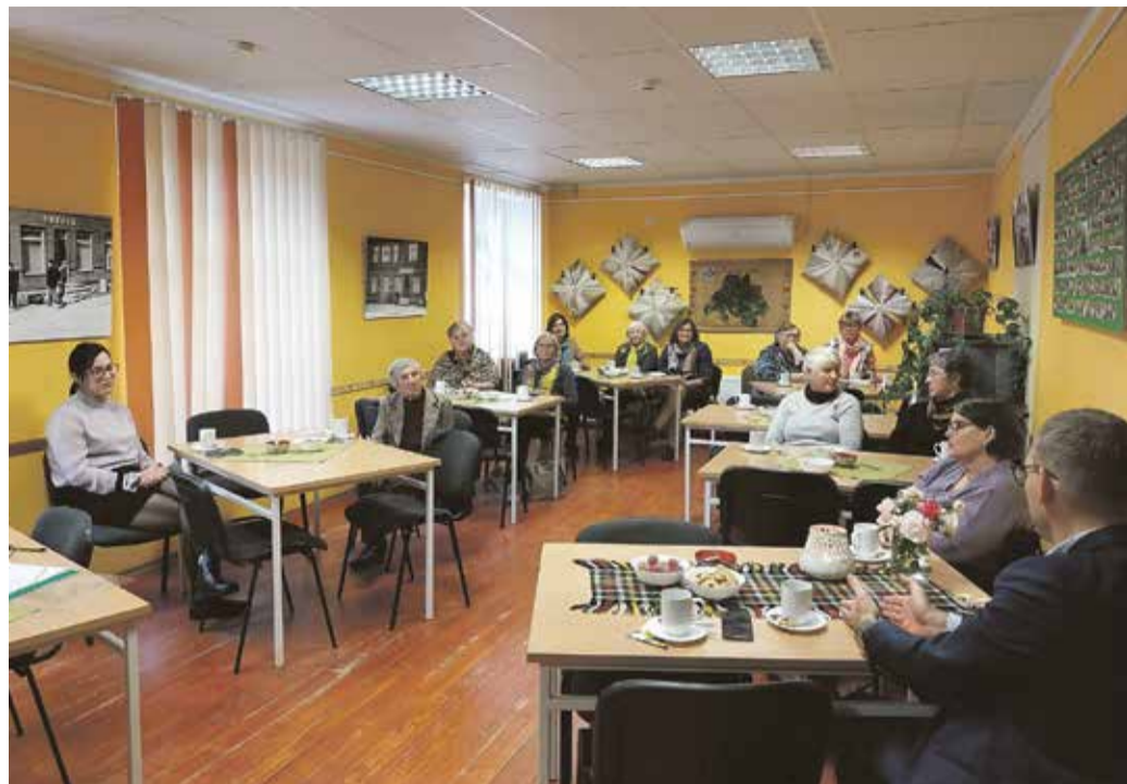
Eakate nõukogu esimene kohtumine.