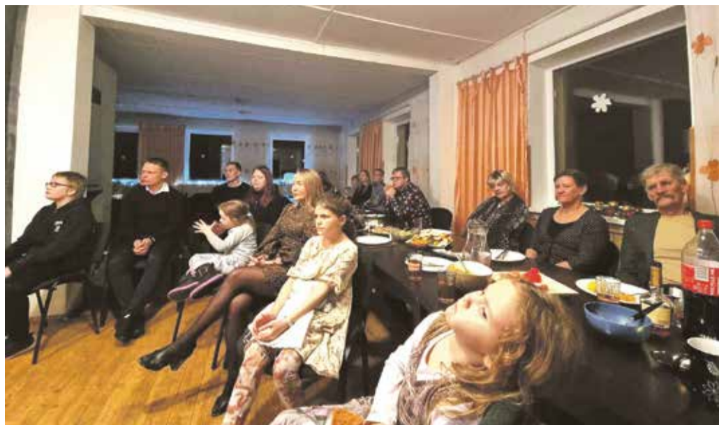
Penuja külamaja viimane pidu tõi saali rahvast täis.

Vana-aasta õhtul said külaelanikud kokku pika laua taga, muusika män-