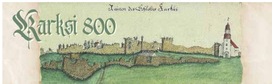
Karksi linnusevaremed, 1797.