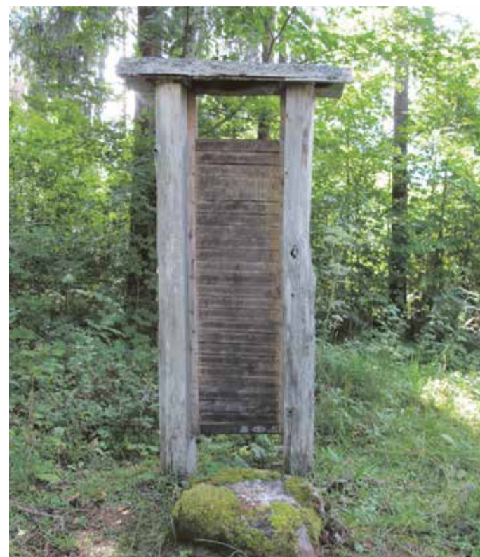
lides hiies Annemäel asuvale ohvrikivile jäetakse münte seniajani.

Orduajaga kaasnes seni vabade talupoegade pärisorjastamine. Maa kuulus vallutajatele, talupoegadele mõõdeti adramaa, mille kasutamise eest tuli maksta loonusrenti. Kasvatati rukist, otra, lina, naerist ja