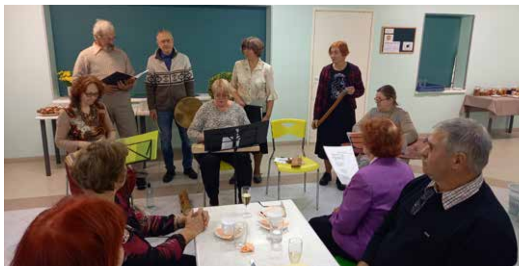
Lätlaste ansambel Dzina.