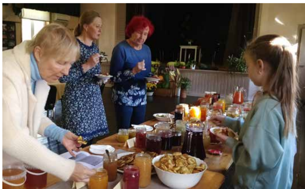
Hoidistajad jagavad kogemusi.

Hoidistamist on paljudes peredes tehtud juba põlvest põlve ja ikka selleks, et hooajalisi maitseid ka talvel nautida. Mõnigi perenaine arvas, et temal küll midagi ei ole maitsemiseks tuua, kõik nii tavaline. Tegelikult täitusid lauad kiirelt purkidega, kuhu oli pistetud väga erinevaid aiasaadusi. Maitsta sai nii soolaseid kui magusaid hoidiseid. Sel päeval sai taas kinnitust tõsiasia, et igal perenaisel on omad retseptid ja