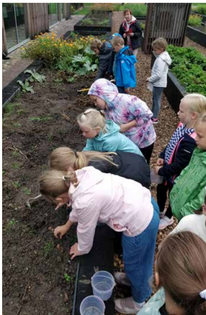
AGK õpilased programmil „Päev talus“. Kartulite võtmine.