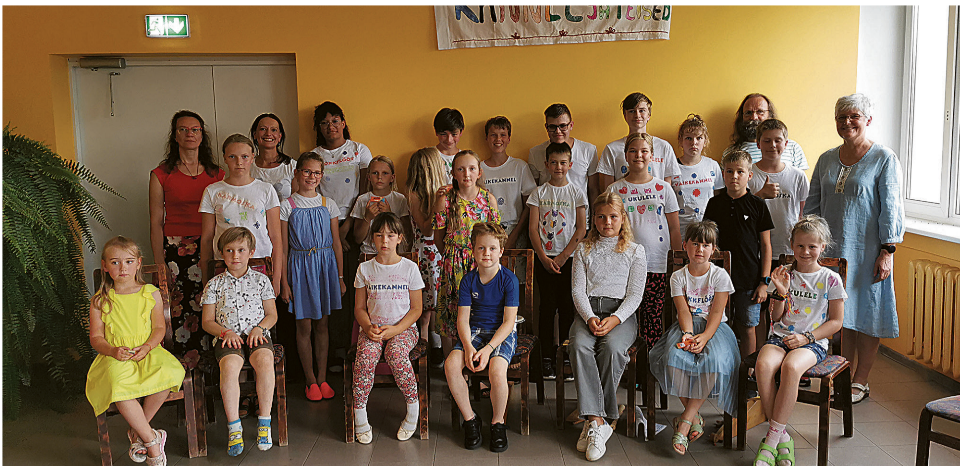
Perimuslaagre lõpetuses tetti Mõisaküla koolimajan laste ja kuulmeistride ütime pilt. Palludel om sellän esi tettu laagresärgi.