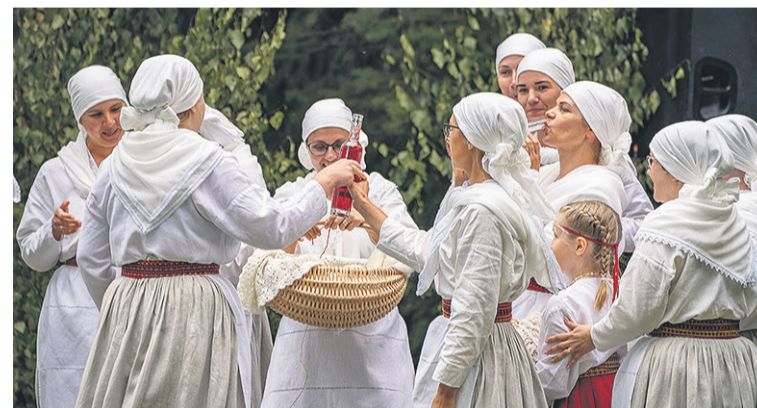
Mulgi naiste aastesõõri sissi käip maarjapuna juumine kah.

leti müüki, jagati aakirjandusele tädust, otsiti võimalusi telekase saia, veeti laiali kuulutusi ja kirjutedi sotsiaalmeedian.