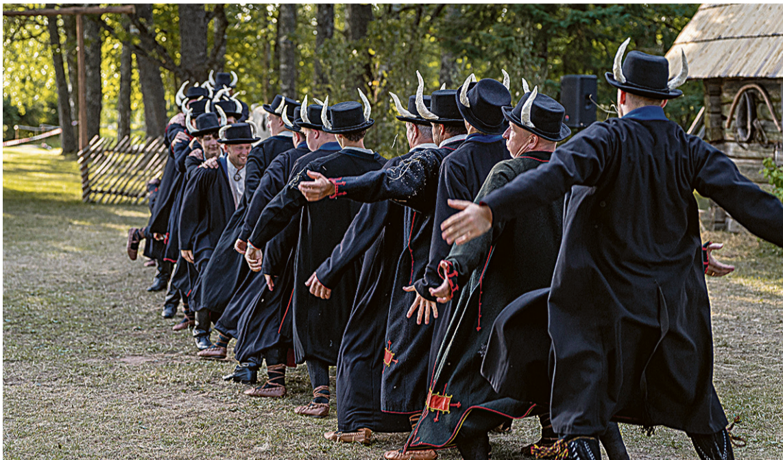
Et Mulgimaa elu edenes ja vaimuperändus saas alla oitu, om mulkel vaja kindeld laani ja ääd iistvedäjet. Pilt kangidest Mulgi meestest om tettu etendusel "Aig veerep armu müüdä".

MKI-lom mitu muret. Päämine neist inimeste puudus – vähä om mulgi kultuuri edendejit, ei ole Mulgimaa vaimuperänduse asjatundjit, kes sedä asja kik aig