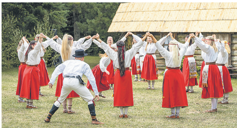
Tansjide taga paistap just selle lavastuse jaoks ehitet oone.