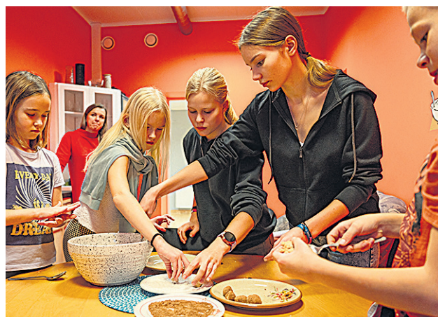
Tõrva noorde käte vahel saive valmis kamapallikse.