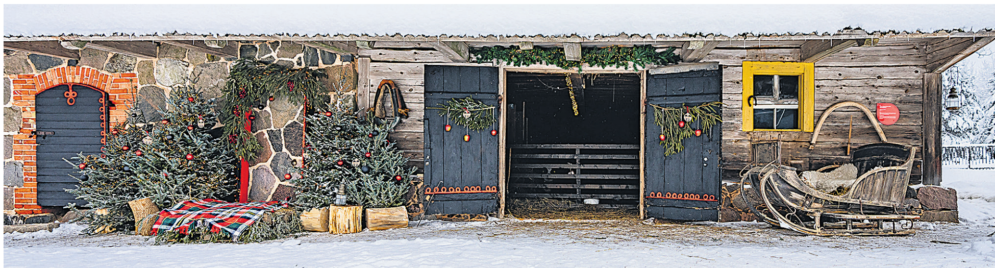
Enne jõulupühi värv Rosenbergi Ülle Mulgi elämuskeskuse vana aidauune usse ärä, tei neile mulgi mustre pääle ja eht kuuseossege ärä.