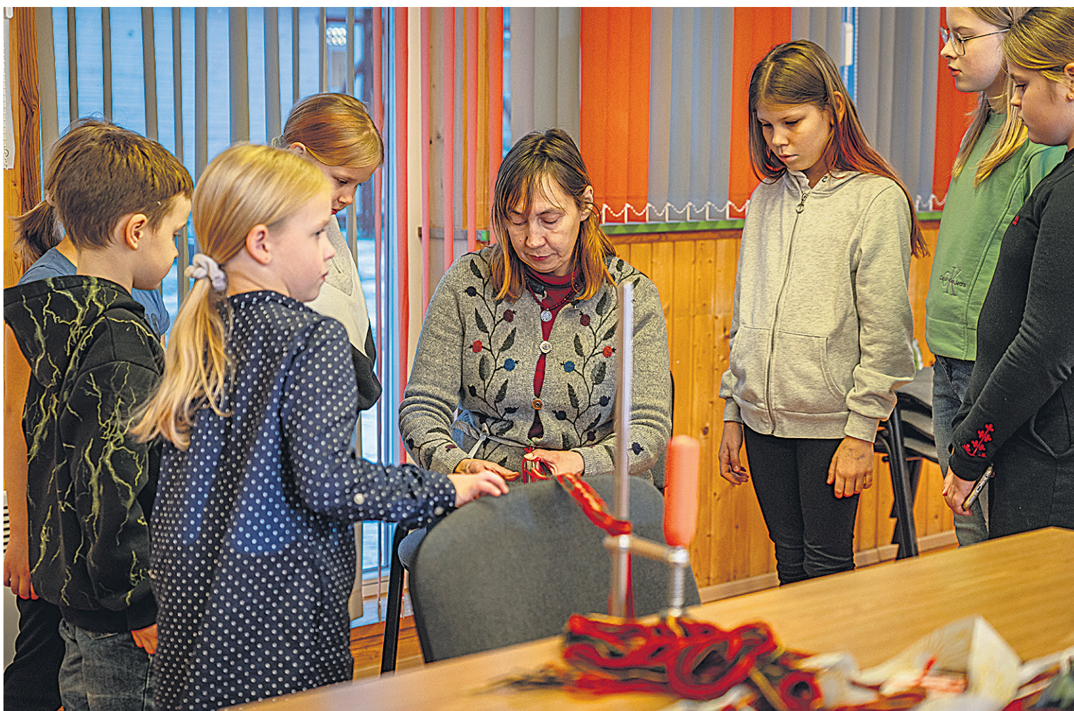
Abja noore saive tüükambren pruuvi, kudas käip kõlapaela tegemine. Tettu pael kõlvas äste võtmeoidjes.