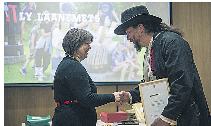
2. detsembrel and Kaasiku Ahto Tartun Laanemetsa Lyle üle iiesöbraligu teo auinna.