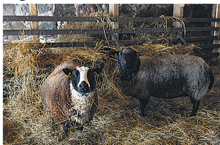
Lamba Machu Picchu ja Mae oodave pai ja levätükki.

Mulgi elämuskeskuse juha-teje Juhi Ülle ütlet, et keskus om külälitel joba üle poole aaste põnevit elämusi pakkun ja luume võtmine om asju loomulik käik. “Siin om midägi silmäle, kõrvale, käele, keelele ja muduki ajule kah. Rahvasuugi ütlet, et elun asi om sii kige paremb asi. Arvesteme sellege elämuskeskuse kah. Pääle sedä, ku mede manu om eläme tullu koheve village lamba ja eri värvi pikk-kõrva, saame ütlet, et talul om elu ja eng. Silmäärõomu ja engekosutust pakuve na nii lastele ku suurdele. Tulge kaeme!”