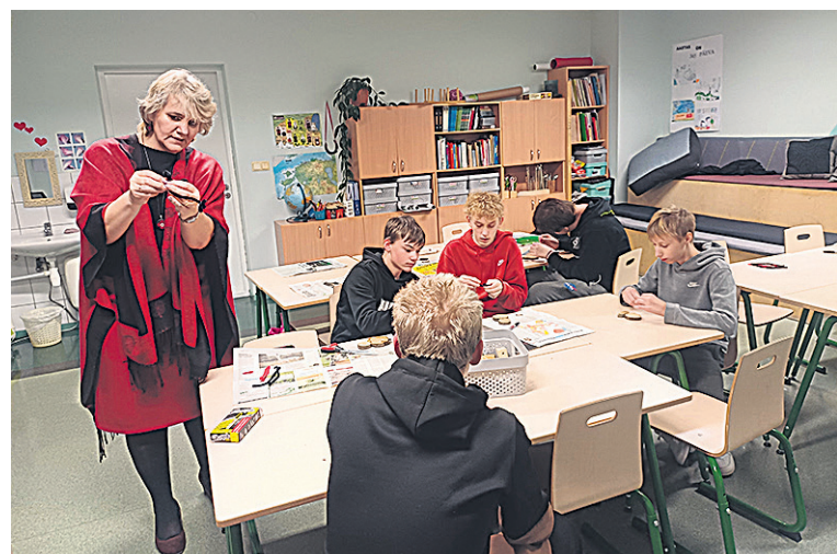
Tiiratsi Inga õpetuse perrä teive latse laagren puust lumemehi.