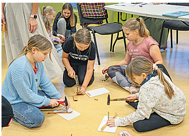
Karksi-Nuian sai egä nuur omale ilusa võtmeoidje tetä.