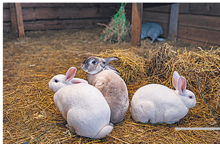
Kodujänesse Naaskel, Muhv ja Krae om sõsare.