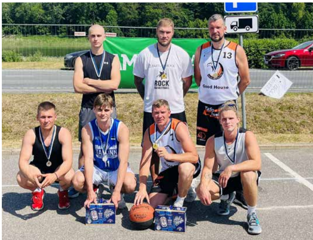
I etapp Karksi-Nuias.