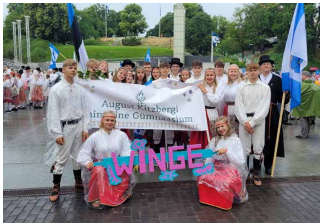
AKG segarühm WINGE.