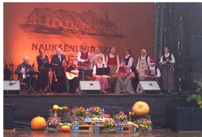
Esinevad kapell Ukapella ja ansambel Dzine.