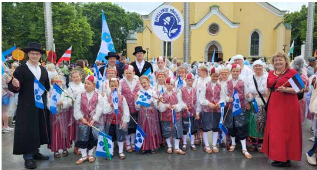
Halliste põhikooli tantsurühm Karikakrad.