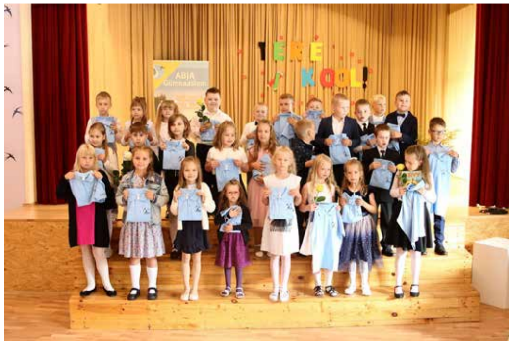
Esimese klassi õpilased hoidmas oma uusi koolivorme.