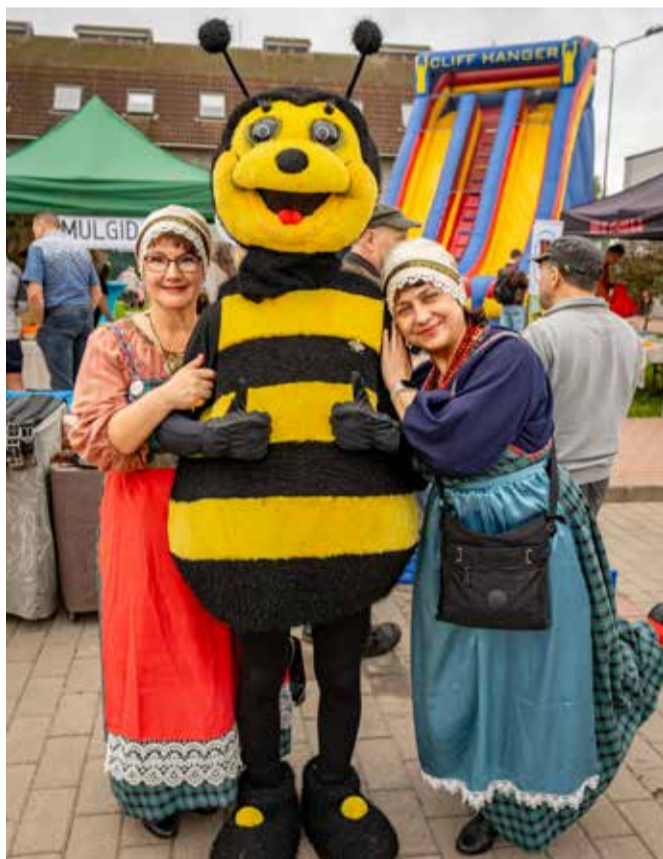
Meepealinnas maskott Mesiline oli festivalil kõikide lemmik.