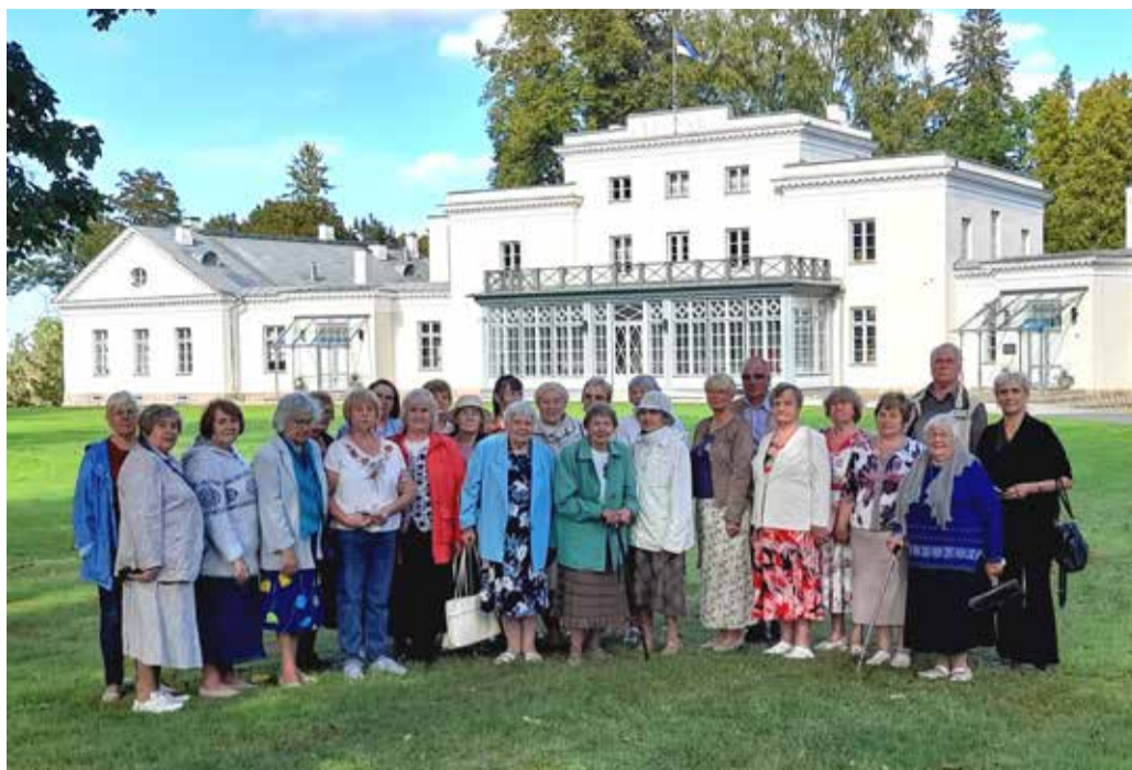
Haridusseltsi liikmed Heimtali kooli eest.

Tarkusepäev Heimtalis oli igati huvitav. Uudistamise restaureeritud mõisaaegset vana ringtalli, mis nüüd on saanud hoopis uue tähenduse. Siin on suurepärane spordikompleks, aga ka klassid arvutiõppeks ja musitseerimiseks. Heimtali kool asub mõisa peahoones – seega mõisakool, mis pakub haridust 155 lapsele. Siin, looduse rüppes, on hea õppida, jutustab mei-