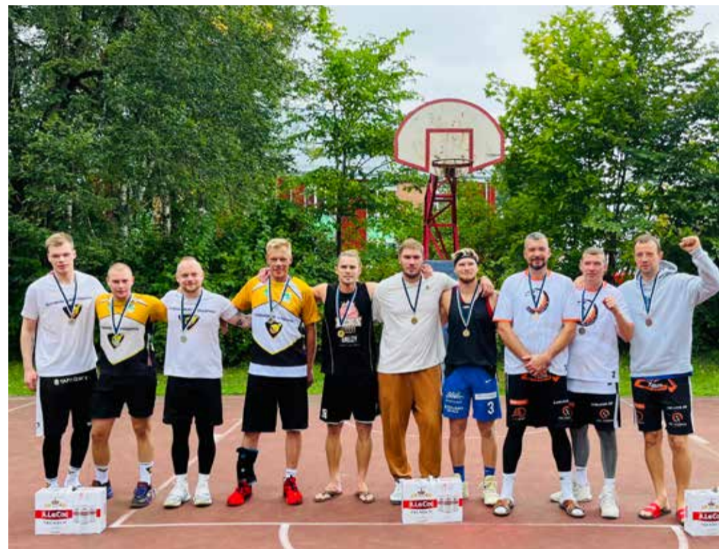
II etapp Tõrvas.