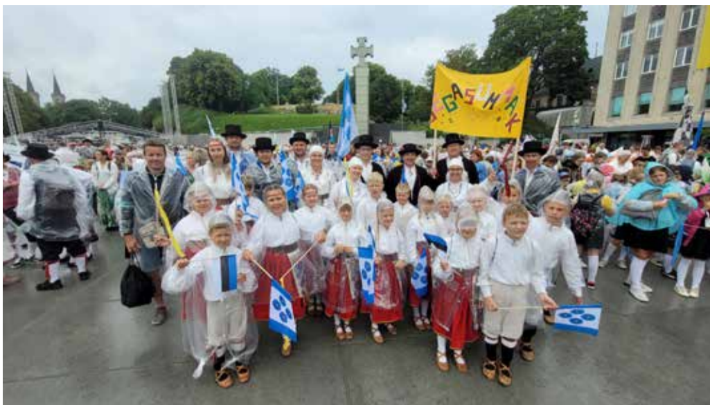
AKG Pererühm Segasummak.

Halliste põhikooli tantsumudilased said esmakordse kogemuse ja tunde, mis tekib siis kui oled pikemalt kodust eemal ning magad ühes klassis kõik koos. Mulgis sõna toimetuse jõudis neile korra ka peo ajal külla, kui oli käimas kibekiire patsipunnimine ja rahvariiete sel-