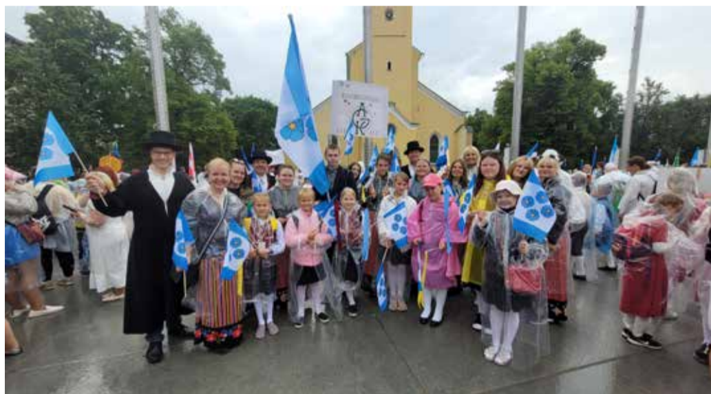
AKG sega- ja mudilaskoor