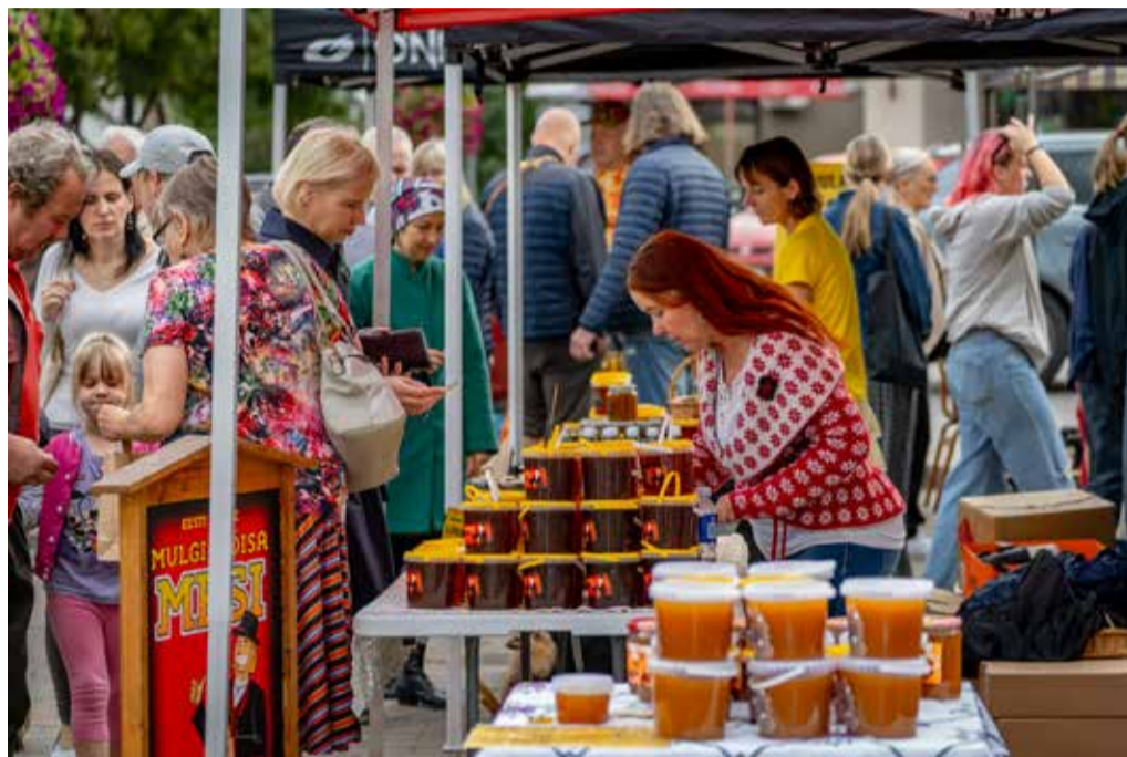
Meefestivalil oli ligi 100 meemüüjat.

Külastajate lemmiku mee konkursilt võttis osa 38 mett. Võitja sai õiguse kasutada edaspidi oma meepurkidel XV