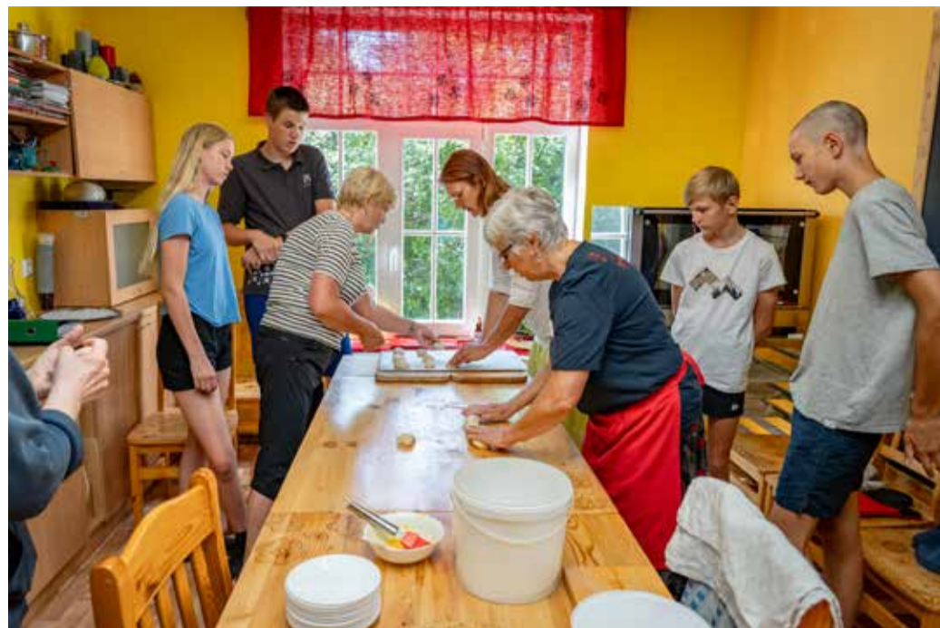
Abja päevakeskuse korbitöötoad oli menud.

Rõõmustas, et mängupunktidest oli kaasatud kogukonna inimesi, et koos tegevusi ellu viia, et omava-