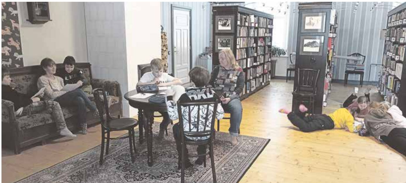
Lapsed koostasid ise muinasjutu ja lugesid seda teistelegi ette.

5. aprillil oli Kulla Leerimajas võimalik valmistada endale üks korralik vitamiinipomm. Koos-