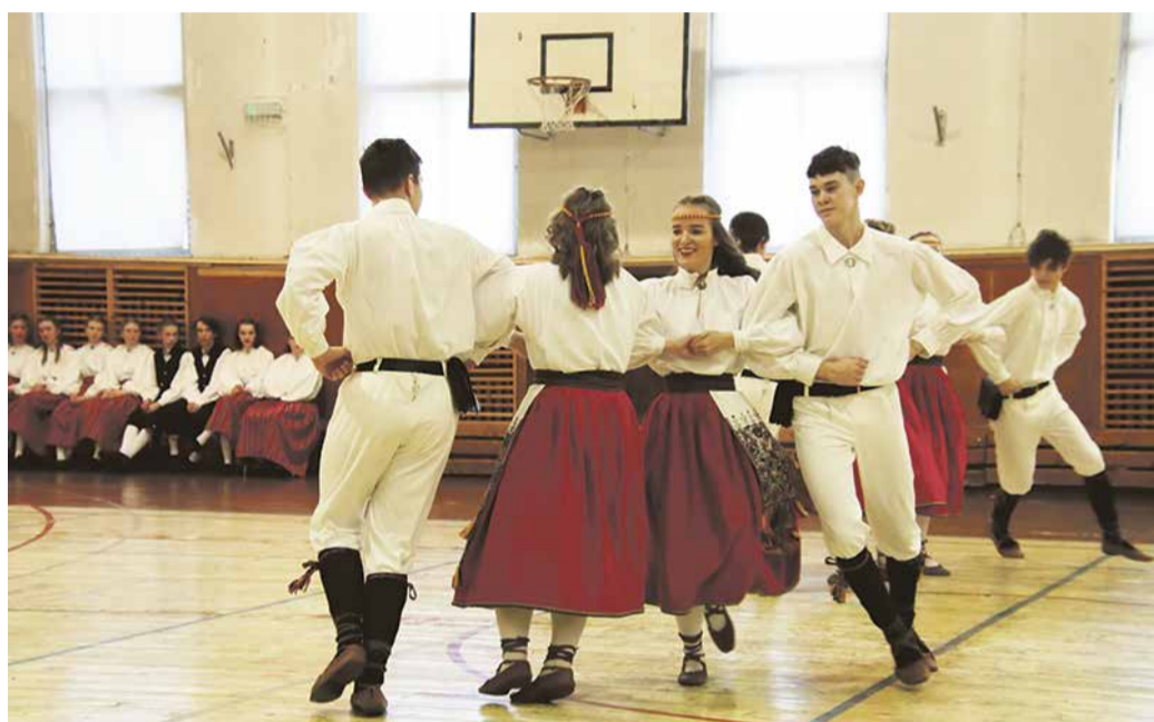
AKG Tantsurühm WINGED ülevaatusel.

Oma lugusid jagasid õpetajad August Kitzbergi nimelisest gümnaasiumist, Abja gümnaasiumist ja Halliste põhikoolist. Kuidas kulges teekond laulupeoni, millised olid väljakutsed ja rõõmud?