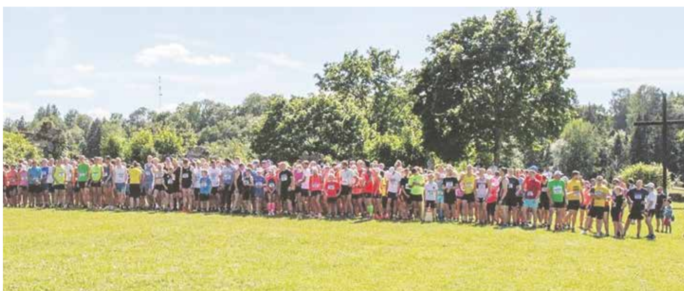
Jaanijooksu start aastal 2019.

Motiveerimaks jooksust osa võtma tugevaid jooksjaid, tõstisime meeste ja naiste üldvõitjate auhinnarahasid, mis olid