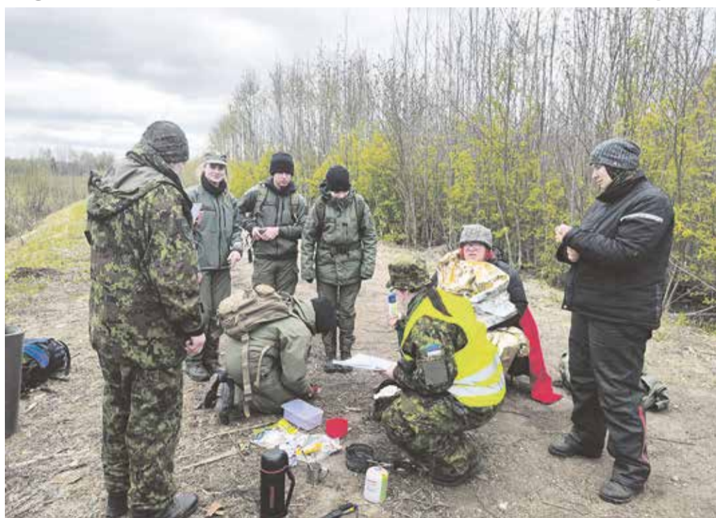
Noorkotkad ja kodutütred nuputavad, kuidas aidata põletushaava ja rästikuhammustusega matkajaid, kelle rolle kehastasid naiskodukaitsjad väga usutavalt.

5. mai õhtul sai Abja gümnaasiumi juurest stardi 13 meeskonda. Noored liikusid ööpäeva jooksul maastikul peaaegu 40 kilomeetrit kontrollpunktist kontrollpunkti, kus tuli täita ette antud ülesandeid. Kui võistkond ei ilmunud kontrollpunkti, läksid talle selle ülesande eest kirja maksimaalsed miinuspunktid. Võistkond