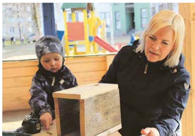
Uku emmega pesakasti meisterdamas.

Mardipäeva eel meisterdasid lapsed koos emmede ja issidega mar-