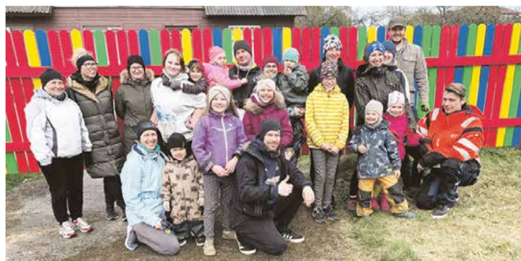
Talgulised uue aia ees.