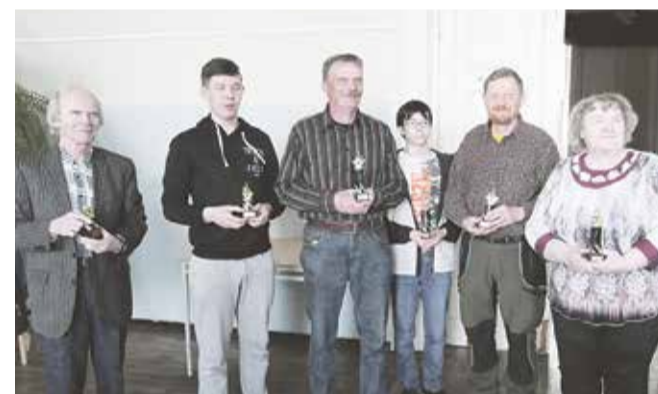
Mulgi male seeriaturniiri võitjad.