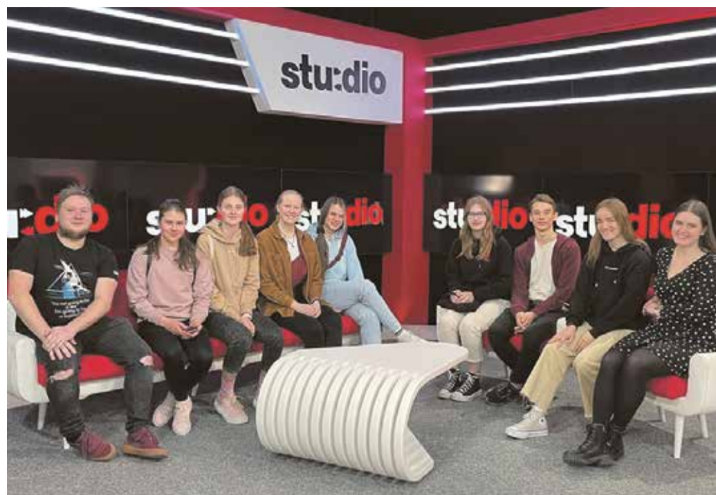
AKG Meediagrupp TV 3 Stuudio saate stuudios.

Päev oli sisutihe ning ülimalt meeleolukas. Mitmed meist said mõtteid