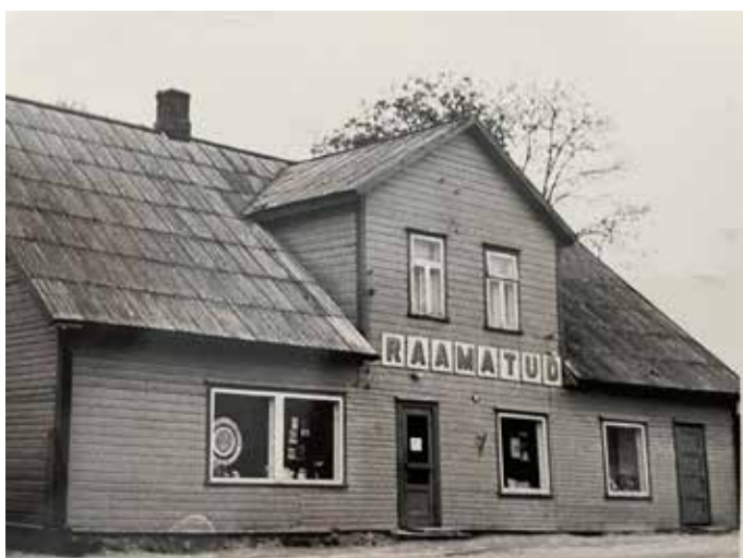
Raamatukogu hoones asub praegu raamatupood.

1946. aastal nimetati raamatukogu valla keskraamatukoguks ja see allus kultuurharidusministeeriumile. Samal ajal anti raamatukogule kolm ruumi majas Pärnu mnt 21. Raamatukogu oli avatud neli korda nädalas.