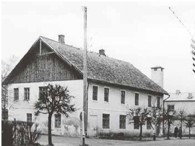
Raamatukogu Eha äri majas.

Alates 1925. a märtsist kuulus Abja Haridusselts Idu raamatukogu Pärnu maakonna Abja valla avalike raamatukogude võrku. Tema ülalpidajaks jäi endiselt Haridusselts Idu. Raamatukogu oli avatud kahel päeval nädalas, igal pühapäeval ja kolmapäeval kaks tundi. Korraga oli lubatud laenutada kuni kaks raamatut kaheks nädalaks. Haridusseltsi Idu liikmetele laenutati tasuta, teistelt võeti tasu 5% raamatu hinnast. Tulu läks haridusseltsile. 1925. a alguseks oli raamatukogul 378 raamatut. Aasta jooksul saadi juurde 97 raamatut. Lugejaid oli 161, külastusi 1612 ja laenutusi 2267 (1925. a aruanne).