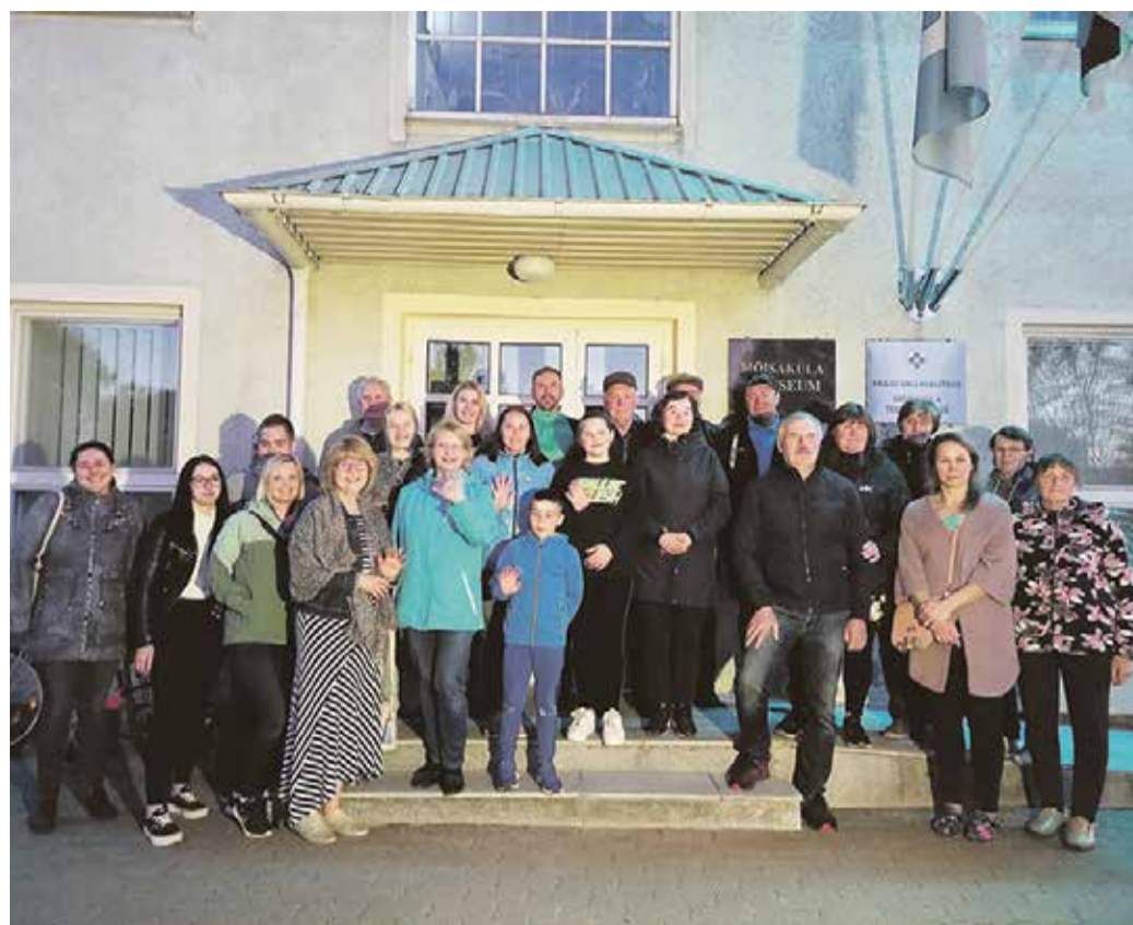
Muuseumiöö öömatkast osavõtjad.