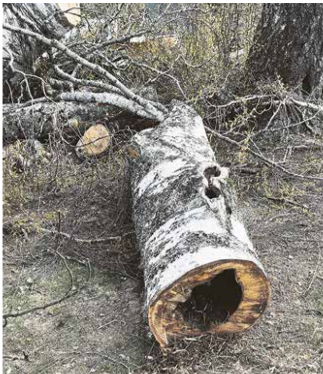
Mahavõetud kask oli seest tühi ja ohtlik ümbekaudsetele liikujatele.

Mina, kallid lugejad, jätan teile valge lehe, mis räägib rohkem kui 1000 sõna.