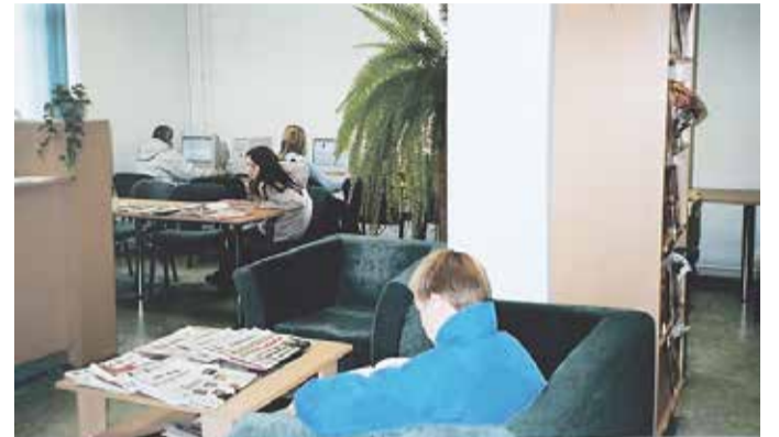
Remonditud raamatukogu ruumid.

Ainult lasteosakond jäi remondita. Kultuuriministeeriumi rahastusega saime uue mööbli.