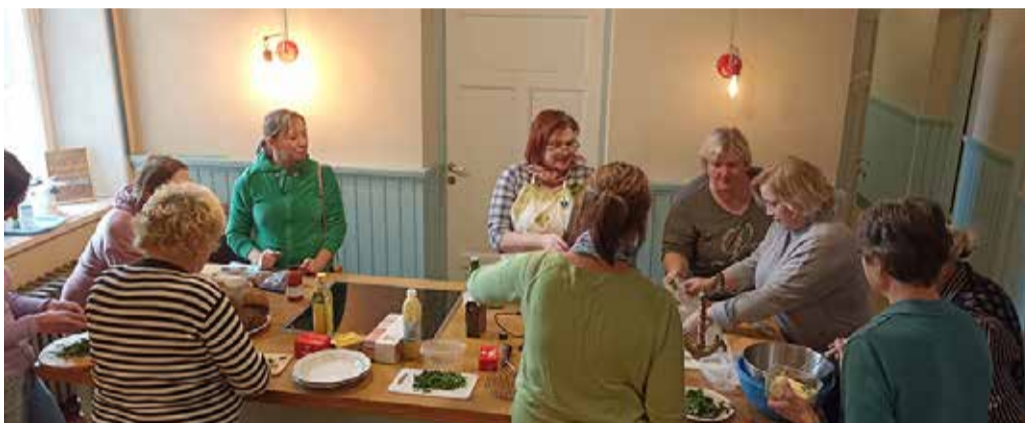
Leerimaja köögist sai karulauguvõi õpituba.