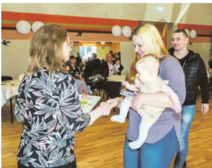
Väikseimad valla elanikud said raamatukogu poolt kingituseks toredate raamatu.