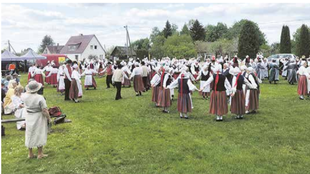
Memme taadi peo peaproov täies hoos.

21. mai oli Mõisaküla signinat saginat täis. Varahommikul kogunesid laadalisel ning kella kümne paiku hakkasid kogunema tantsijad, lauljad ning pillimehed üle terve Viljandimaa, et koos maha pidada järjekordne lustlik memme-taadi pidu. Esinejad võisid peo eel nautida pargi ilu ning tutvuda laadal pakutavaga. Pärast peaproove ja kosutavat lõunasööki koguneti kesklinna rongkäiguks ning suunduti rõõmuhõisetega suveaeda kontserdipaika.