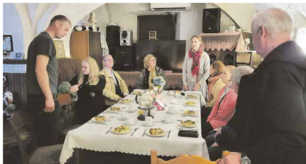
Mäe-Koda võttis meid vastu maitsva plaadikoogiga.

Juunis alustab tegevust uus meelelahutus-