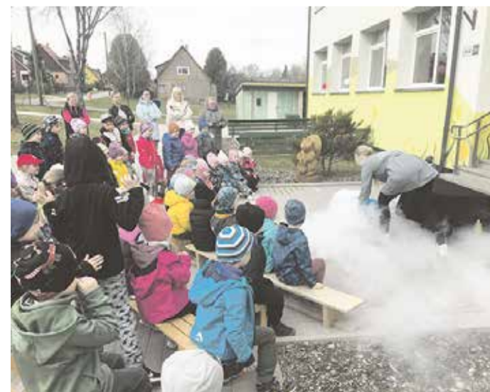
Kolme Pörsakese teadusteater lapsi rõõmustamas.