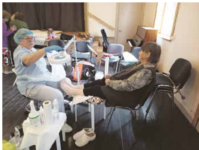
Kohtumine jalaravi spetsialistiga.

Küllil Tiivel rääkis põhjalikult naha- ja varbaküünte seenhaigustest, mis on põhjustatud nahal ja küüntel parasiteerivatest patogeensetest seen-