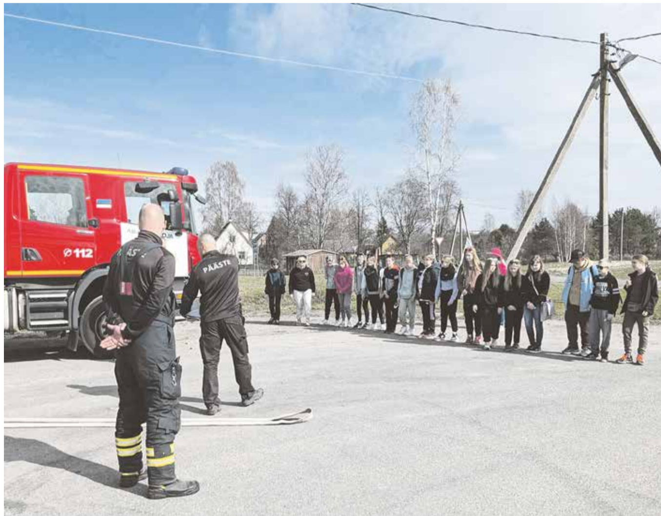
Abja gümnaasiumi 5. klass kuulab päästepunkti juhiseid.

Maastikumängu õnnestumisse on alati panustanud ja panustasid ka nüüd mitmed koostööpartnerid ja kogukonnaliikmed. Kontrollpunktidega olid väljas politsei, pääste ja meditsiin. Samuti Kaitseväe Noored Kotkad ja Kodutütred. Kogukonnast liitusid lasteaid, noortekeskus, raama-