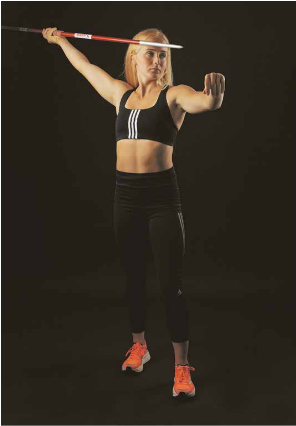
Odaviskaja Gedly Tugi.