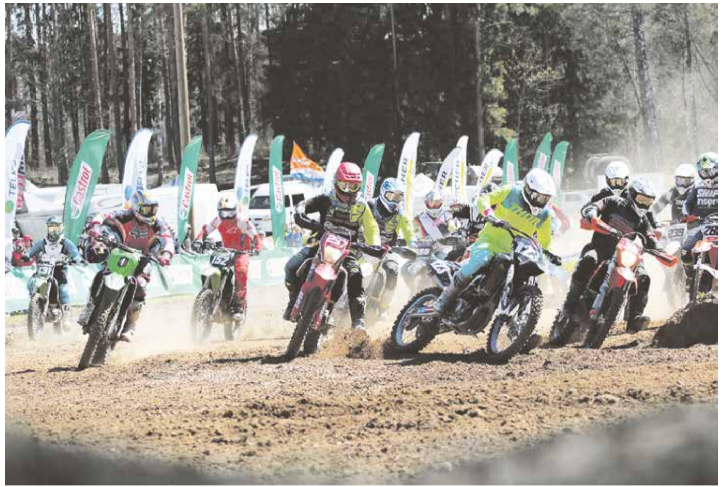
Mulgi suursõit Ainja rajal.

Mulkide omavaheline mõõduvõtt on nüüdseks juba päris kenakese ajalooga võistlus. Algas see kõik 2013. aastal, kuid esiti läksid omavahel võistlema toonase Karksi valla mehed. Võidu-