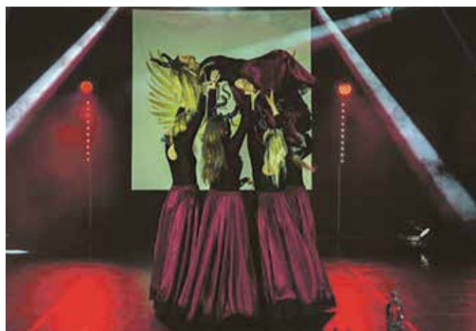
Tantsukonkurss Rise and Dance 2022.