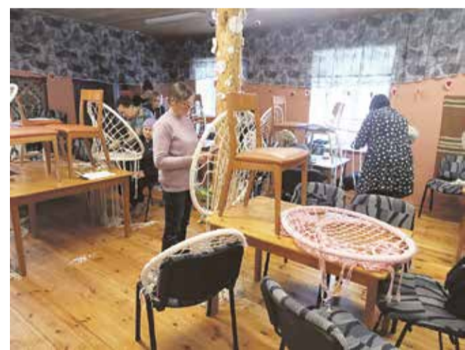
Uhked makrameetoolid valmimas.