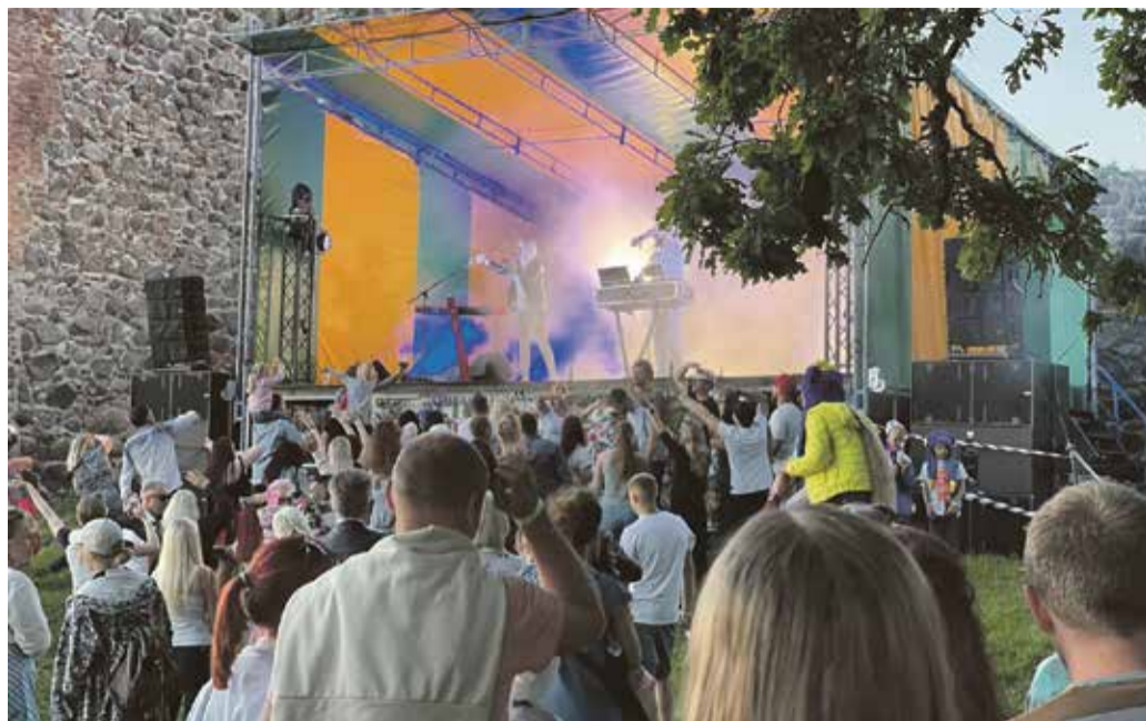
Jaanipidu Karksi ordulinnuses.

Suureks õnneks on viimastel jaanipäevadel olnud superilusad ilmad, tänu millele on olnud võimalik nautuke n-ö rasva koguda, mis kehvatel aegadel marjaks