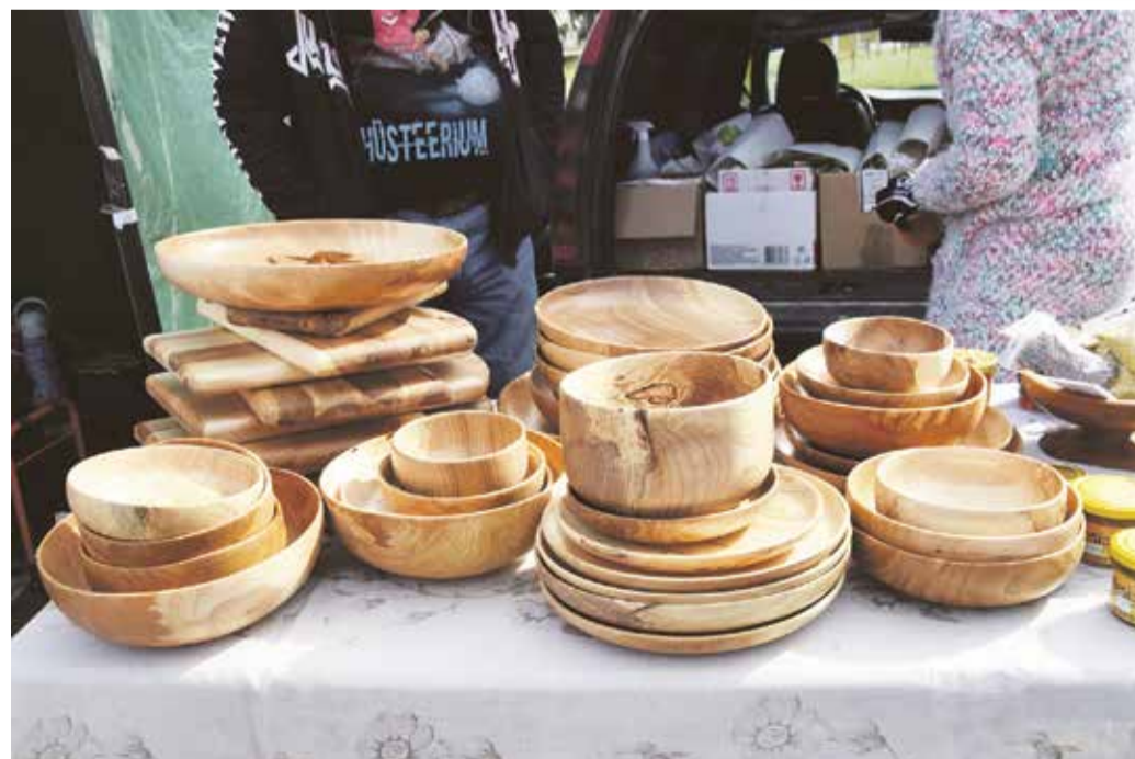
Põnevat käsitööd võib leida Mulgi vallas toimuvatelt laadadelt.