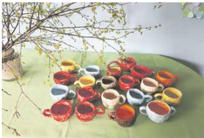
Jänkude rühma laste meistriteosed.