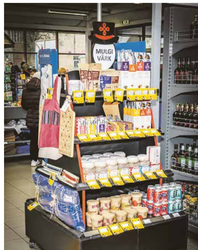
Mulgimaa toidu tooteid võib leida kohalikest poodidest.