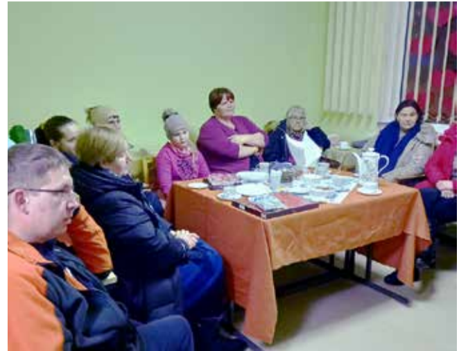
Vestluring Õisu Külatoas.