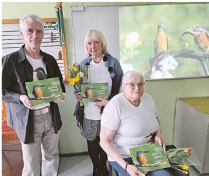
Jäälinnu raamatu autorid.